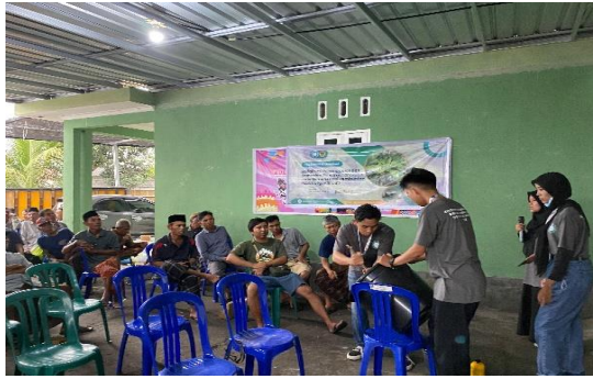
Gambar 4. Demonstrasi pembuatan pestisida nabati

Kegiatan ini turut mengimplementasi poin Sustainable Development Goals (SDG's) ke-12 yaitu Responsible Consumption and Production (Memastikan pola konsumsi dan produksi yang berkelanjutan). Poin ke-12 SDG's ini memiliki tujuan untuk memastikan pola konsumsi dan produksi yang berkelanjutan secara global serta pengurangan limbah dan praktik produksi yang ramah lingkungan. Program ini melibatkan partisipasi aktif warga setempat khususnya yang berprofesi petani dan program ini juga didukung oleh semua Kawil di Desa Tumbuh Mulia. Sebanyak 10 kg limbah organik digunakan dalam demonstrasi pembuatan pestisida nabati tersebut.