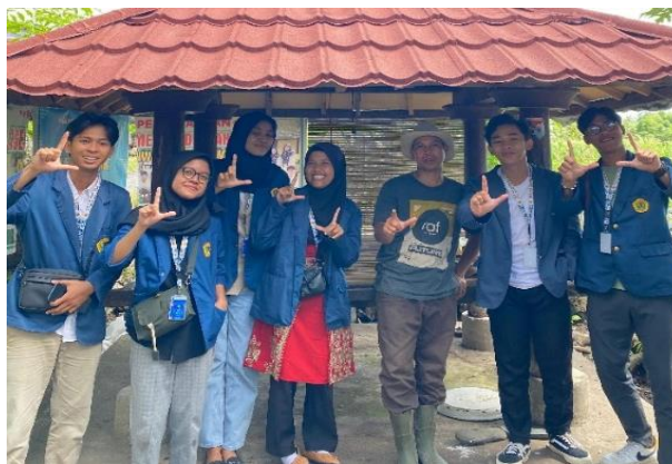
Gambar 2. Diskusi dengan ketua kelompok tani

Kegiatan sosialisasi dalam rangka program kerja pemberdayaan masyarakat desa ini diawali dengan melakukan diskusi dengan para kelompok tani untuk membahas permasalahan dan keluhan petani yang terjadi di Desa Tumbuh Mulia selama ini. Setelah berdiskusi, kegiatan selanjutnya adalah melakukan perizinan dan konfirmasi kepada para ketua kelompok tani, kepala wilayah, dan kepala desa setempat. Kegiatan ini dilakukan untuk menginformasikan tujuan dan mekanisme sosialisasi terkait pengendalian HPT beserta demonstrasi pembuatan pestisida nabati. Hasil dari diskusi ini menunjukkan bahwa para masyarakat setempat, khususnya para kelompok tani mengapresiasi kegiatan sosialisasi ini. Hal ini dikarenakan hasil pertanian mengalami penurunan atau dapat dikatakan gagal panen yang disebabkan karena hama dan penyakit yang menyerang tanaman dan kegiatan tersebut diharapkan dapat menjadi solusi atas permasalahan pertanian yang terjadi selama ini di Desa Tumbuh Mulia.