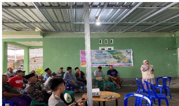
Gambar 3. Pemaparan materi mengenai penanggulangan HPT

Penerapan pengelolaan hama terpadu (PHT) pada tanaman dapat mengurangi penggunaan pestisida kimia secara berlebihan sehingga dapat mengurangi residu kimia pada tanaman. Oleh karena itu, dilakukan penyuluhan pada para petani setempat. Kegiatan penyuluhan kepada para petani dilaksanakan melalui pemaparan materi mengenai pengendalian hama dan penyakit pada tanaman oleh UPT PP kecamatan Suralaga. Peserta kegiatan berjumlah 38 orang terdiri dari ketua dan anggota kelompok tani setiap dusun. Materi yang disampaikan antara lain adalah: jenis hama dan penyakit yang menyerang tanaman; teknik identifikasi hama dan penyakit pada tanaman; serta teknik pengendalian hama dan penyakit yang menyerang tanaman. Kegiatan penyuluhan dilakukan secara dua arah, tidak hanya berupa presentasi materi melainkan juga diskusi dengan para petani.