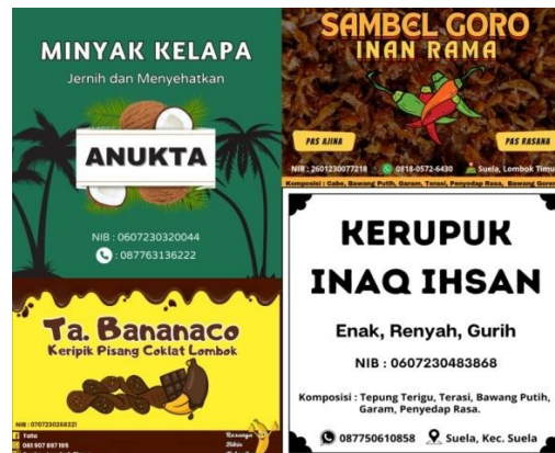
Gambar 2. Label Produk yang Sudah Dibuat Sebagai Syarat Pendaftaran SPP-IRT

Setelah terbitnya Nomor Induk Berusaha (NIB), selanjutnya pendaftaran Sertifikat Produksi Pangan Industri Rumah Tangga (SPP-IRT). Pendaftaran SPP-IRT dilakukan dengan cara melakukan pengajuan pada OSS dan akan diarahkan ke link yang berbeda yaitu spirt.pom.go.id untuk pengisian data selanjutnya. Pengisian data tersebut adalah menginput data pelaku usaha termasuk NIB yang sudah ada, menginput data produk, dan menginput label produk. Pada Pengajuan SPP-IRT secara otomatis akan divalidasi oleh sistem dan No P-IRT akan terbit secara otomatis. Sebelumnya Mahasiswa KKN-PMD Universitas Mataram membantu dalam pembuatan label produk para UMKM yang menjadi persyaratan pada saat pendaftaran SPP-IRT. Menurut (Yamin et al., 2023), penerbitan Perizinan Industri Rumah Tangga (PIRT) bertujuan meningkatkan kepercayaan konsumen pada semua segmen pasar. Dengan adanya perizinan PIRT, maka dengan begitu usaha pangan olahan lebih aman di konsumsi, dan dapat meningkatkan jaringan pemasaran.