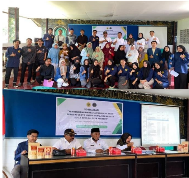
Gambar 5. Sosialisasi Tentang Legalitas Izin Usaha dan Pemasaran Produk