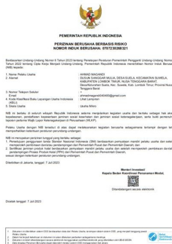
Gambar 3. Dokumen NIB yang sudah diterbitkan melalui OSS

Setelah langkah pembuatan akun akses ke OSS, selanjutnya adalah cara mendaftarkan UMKM tersebut untuk memperoleh Nomor Induk Berusaha (NIB) dengan beberapa langkah berikut: