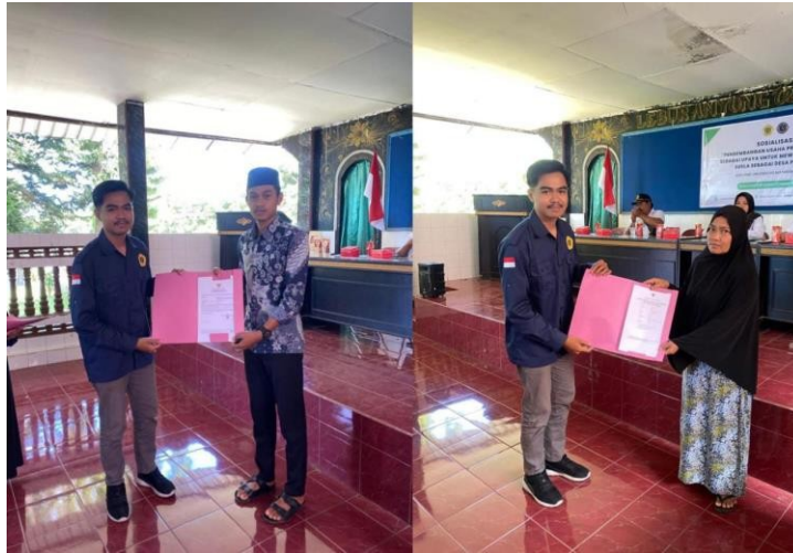
Gambar 6. Penyerahan Berkas Izin Usaha (NIB dan SPP-IRT)

Selanjutnya adalah tahap terakhir yaitu penyerahan berkas sertifikat izin usaha (NIB dan SPP-IRT) kepada para UMKM yang sudah dibantu sekaligus pelatihan ulang tentang tata cara menggunakan OSS supaya para UMKM yang bersangkutan apabila nantinya ingin menambah jenis produk usahanya bisa mendaftarkan diri secara mandiri.