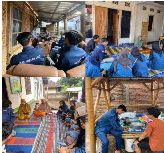
Gambar 1. Survey dan Kunjungan ke UMKM yang Belum Memiliki Izin Usaha

Pada tahap pertama yaitu melakukan kunjungan kepada UMKM di setiap Dusun yang ada di Desa Suela untuk memberikan informasi terkait dengan pentingnya perizinan berusaha bagi para UMKM untuk kelangsungan usahanya. Selain itu juga Mahasiswa KKN-PMD Universitas Mataram melalui programnya dalam membantu para UMKM menerbitkan izin usaha bagi yang belum memiliki izin. Membantu para UMKM membuat izin usaha dilatar belakangi karna pembuatan akun sekaligus pendaftaran izin usaha sekarang dilakukan secara online melalui website/aplikasi (OSS). Online Single Submission (OSS) merupakan salah satu website yang disediakan oleh Dinas Penanaman Modal dan Pelayanan Terpadu Satu Pintu (PMPTSP) yang bertujuan untuk memudahkan para pelaku UMKM dalam mengajukan permohonan izin usaha berbasis online.