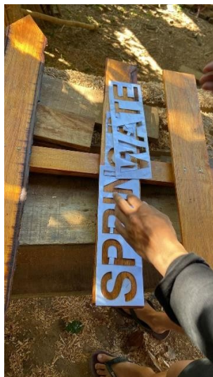
Gambar 7: Proses penulisan di plang sekaligus mengecat plang