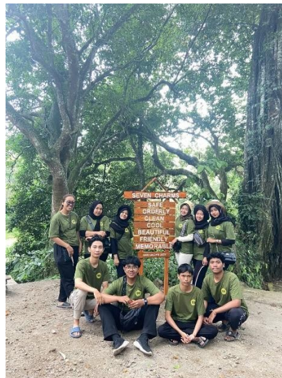
Gambar 10: Finishing pemasangan plang