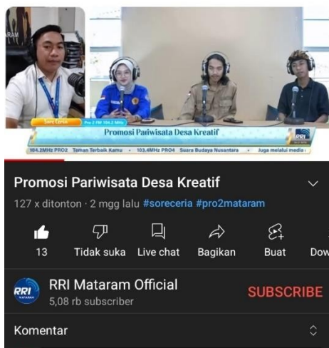
Gambar 13: Promosi wisata melalui podcast youtube RRI Mataram