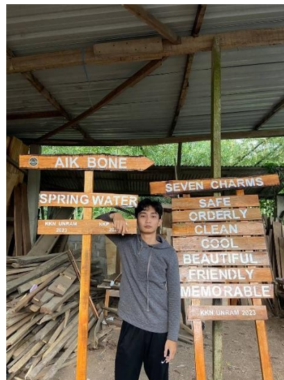
Gambar 8: Finishing plang