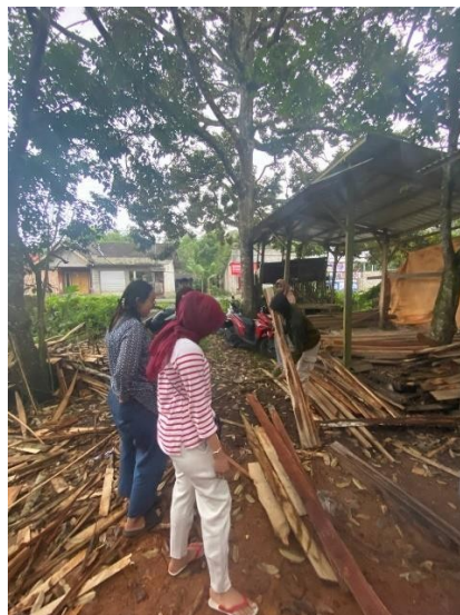
Gambar 2: Pemilihan kayu