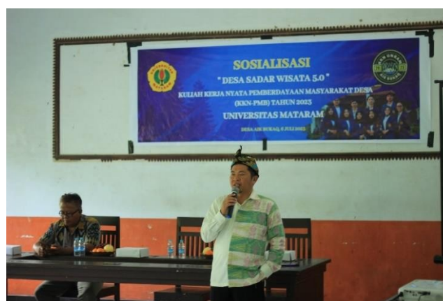
Gambar 16: Pembahasan materi Sosialisasi Sadar Wisata