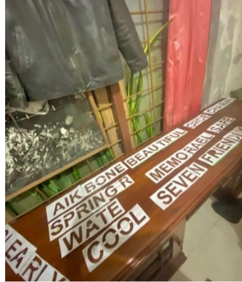
Gambar 6: Finishing cetakan huruf