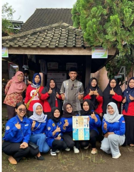
Gambar 18 : Sosialisasi Stunting di posyandu Dusun Aik Bukaq