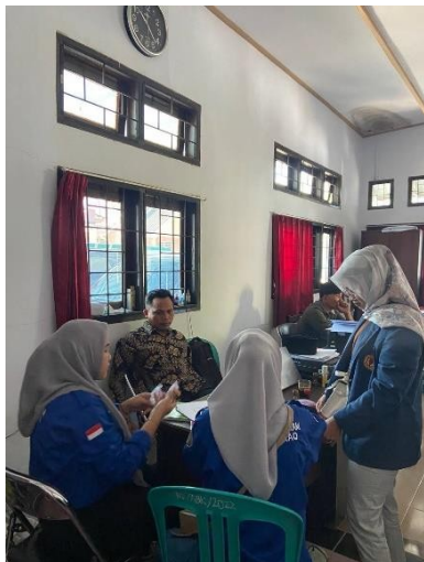
Gambar 23: Picket membuat surat keterangan nikah