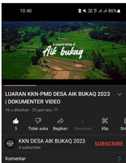
Gambar 11: Postingan promosi akunyoutube KKN Desa Aik Bukaq