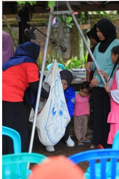
Gambar 17: Sosialisasi Stunting di POSYANDU Dusun Aik Bukaq