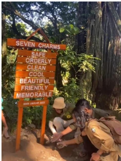
Gambar 9: Pemasangan plang di Hutannyaik Bone