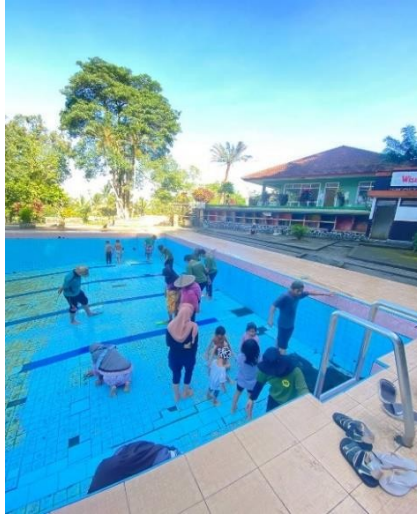
Gambar 21: Bersih-bersih Kolam Aik Bukaq