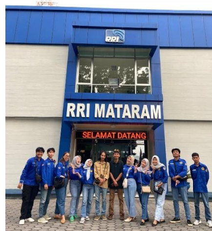
Gambar 14: Foto bersama anggota dan talent podcast youtube