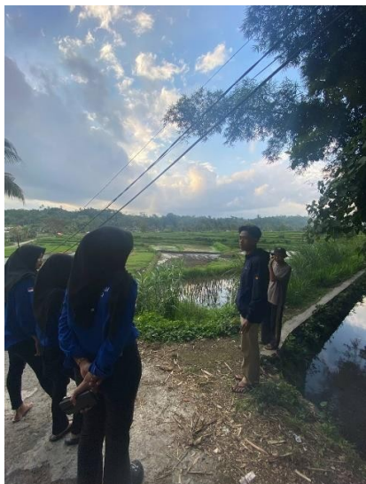
Gambar 1: Proses pembuatan jalur

tempat wisata di Desa Aik Bukaq. Dengan demikian, diharapkan minat wisatawan untuk mengunjungi tempat wisata di Desa Aik Bukaq