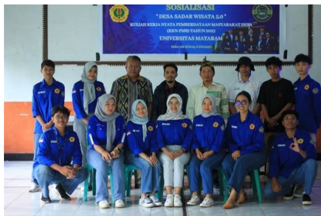
Gambar 15: Sosialisasi Sadar Wisata