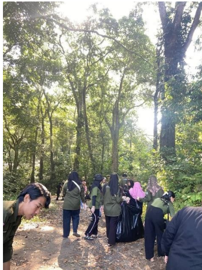
Gambar 22: Bersih-bersih lingkungan sekitar desa