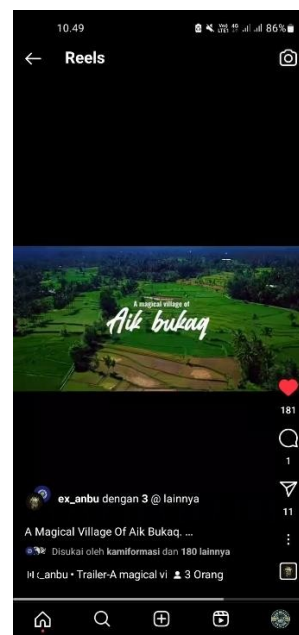
Gambar 12: Postingan promosi akun Instagram oleh komunitas pemuda DesaAik Bukaq