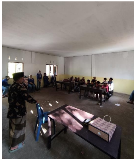
Gambar 20: Kegiatan mengajar Bahasa Inggris di sekolah