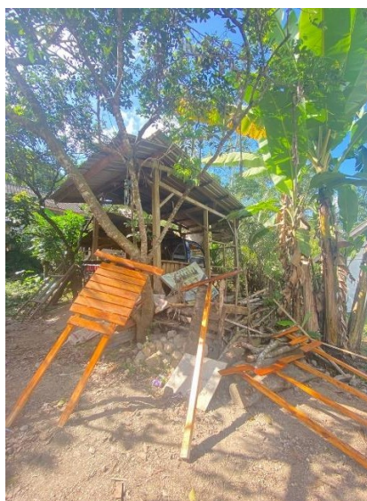
Gambar 4: Pembuatan plang