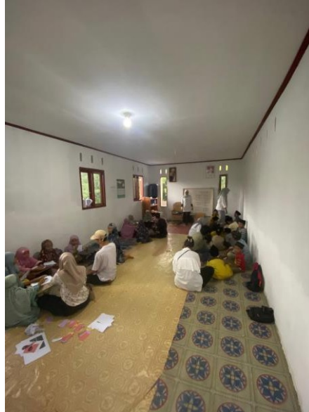
Gambar 19: Kegiatan mengajar Bahasa Inggris di TPQ Bintang Sinar Lima