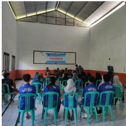
Gambar 24: Picket penyerahan BLT