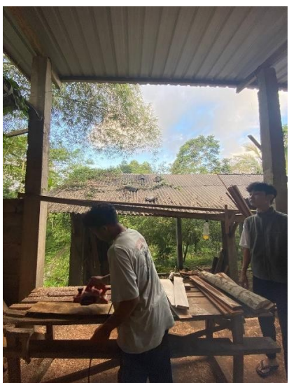
Gambar 3: Pemotongan kayu dan mengampelas kayu