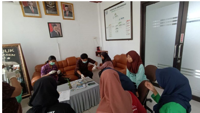
Gambar 4. Pengecekan kesehatan dan donor darah di Lingkungan BPIU2K