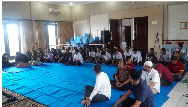
Gambar 2. Kegiatan keagamaan periodik di BPIU2K

buka puasa bersama yang dilakukan ini dilanjutkan dengan menikmati hidangan berupa aneka macam kudapan dan diakhiri dengan solat magrib berjamaah. Kegiatan pengajian dan buka bersama dilaksanakan pada tanggal 23 Maret 2023 bertempat di Mushola Al-Ikhlas BPIU2K Karangasem, Bali. Kegiatan yang dilakukan ini melibatkan para pegawai, staff, serta mahasiswa magang baik yang beragama muslim maupun non muslim dengan tidak membedakan suku maupun agama yang ada di lingkup BPIU2K. Kegiatan tersebut dapat berjalan dengan baik. Hal tersebut menunjukkan bahwa dalam hal ini nilai pancasila masih di junjung tinggi. Menurut Noviyanti (2021) dengan adanya aktivitas pengajian yang dilakukan berupaya untuk meningkatkan kesadaran masyarakat serta menciptakan lingkungan yang damai. Kegiatan keagamaan periodik BPIU2K dapat dilihat pada gambar 2.