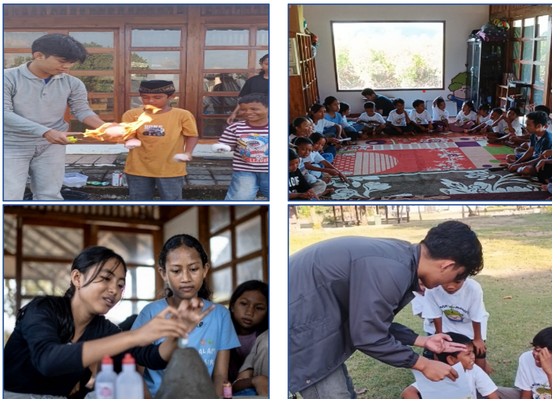
Gambar 3. Kegiatan fun math dan sains experiment

Program edukasi dilaksanakan di Sanggar Belajar “Jalan Pulang” yang menjadi pusat kegiatan belajar informal anak-anak lokal. Materi pembelajaran dirancang menarik dan kontekstual diantaranya fun math sebagai pembelajaran matematika berbasis permainan untuk meningkatkan minat belajar pada materi pola bilangan. Selanjutnya sains eksperimen sebagai percobaan sederhana seperti reaksi larutan asam-basa untuk melatih rasa ingin tahu ilmiah. Kegiatan selanjutnya Adalah mini olimpiade sebagai lomba pengetahuan dan keterampilan yang memacu semangat kompetitif sehat. Hasil pengamatan menunjukkan antusiasme tinggi, terutama pada kegiatan eksperimen yang melibatkan alat peraga. Metode ini efektif meningkatkan pemahaman karena peserta dapat menghubungkan konsep ilmiah dengan fenomena yang mereka temui di lingkungan sekitar.