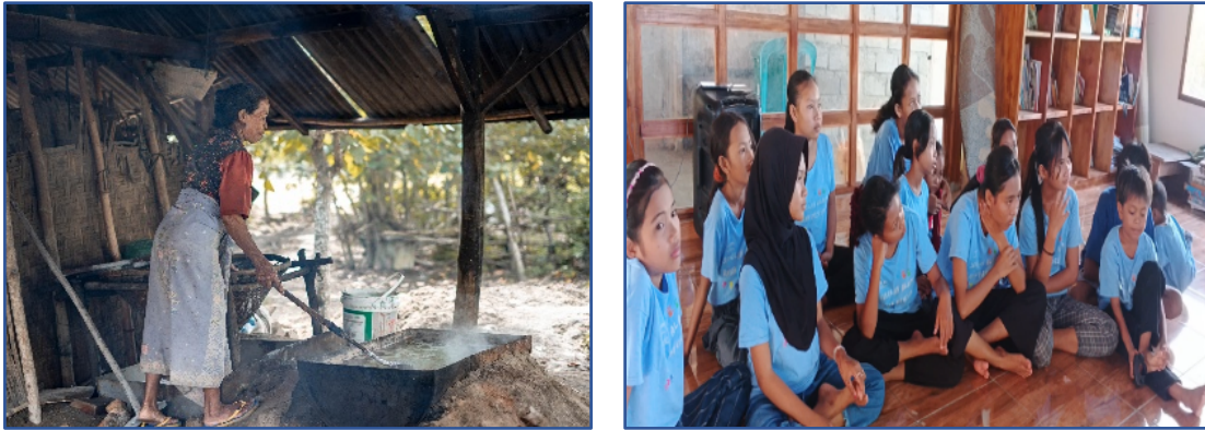
Gambar 4. Kegiatan ekonomi promosi pariwisata dan produksi garam oleh masyarakat

Promosi digital terbukti menjadi strategi efektif dalam memperluas jangkauan pasar wisata maupun produk lokal (Rahmawati & Prasetyo, 2021). Kegiatan ekonomi bertujuan meningkatkan potensi pendapatan masyarakat melalui optimalisasi sumber daya lokal. Kegiatan pada bidang ekonomi ini meliputi pembuatan video promosi ekowisata dengan konten yang menampilkan keindahan hutan mangrove, aktivitas wisata, dan budaya lokal, lalu dibagikan di media sosial untuk meningkatkan jumlah kunjungan. Kegiatan selanjutnya adalah pendampingan pemasaran garam lokal yang bertujuan untuk mengenalkan produk tersebut kepada masyarakat luar melalui promosi di media sosial. Masyarakat mulai memahami bahwa pemasaran tidak hanya bergantung pada kunjungan langsung, tetapi juga dapat dilakukan secara online. Pelatihan penjualan daring juga diajarkan kepada anak-anak dan remaja mengenai dasar penggunaan platform e-commerce untuk memasarkan produk. Keterlibatan anak-anak dalam pelatihan penjualan daring diharapkan menjadi bekal keterampilan ekonomi digital di masa depan.