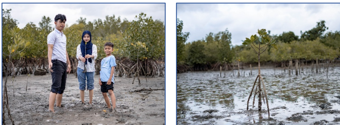
Gambar 2. Penanaman bibit mangrove