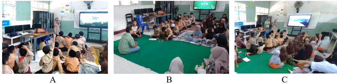
Gambar 1. Kegiatan penyampaian materi melalui video dan tanya jawab. (A) Penyampaian materi specimen awetan, (B) Penyampaian materi biodiversitas TNGR, dan (C) Tanya jawab

penyampaian materi dengan baik. Dalam kegiatan ini guru diberikan gambaran untuk mengembangkan bahan ajar yang menarik dan interaktif, yang dapat digunakan dalam pembelajaran IPA di kelas.