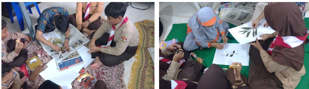
Gambar 2. Kegiatan praktik membuat herbarium.

Tahap berikutnya dalam kegiatan pengabdian ini adalah melakukan kegiatan praktik yang diikuti oleh guru dan siswa peserta target. Guru dan siswa diminta terjun langsung ke lapangan untuk mempraktikkan teori yang telah disampaikan sebelumnya mengenai koleksi tanaman dan serangga untuk herbarium dan insektarium sederhana. Untuk pembuatan herbarium, koleksi spesimen tanaman dilakukan baik oleh guru maupun siswa. Hasil koleksi dikeringkan dan dipres menggunakan alat sasak selama lebih kurang 1 minggu dan setelah kering spesimen disusun di atas kertas gambar ukuran A3. Hasil herbarium setelah diberi nama spesies juga diberi nama kolektor atau nama siswa / guru yang melakukan koleksi.