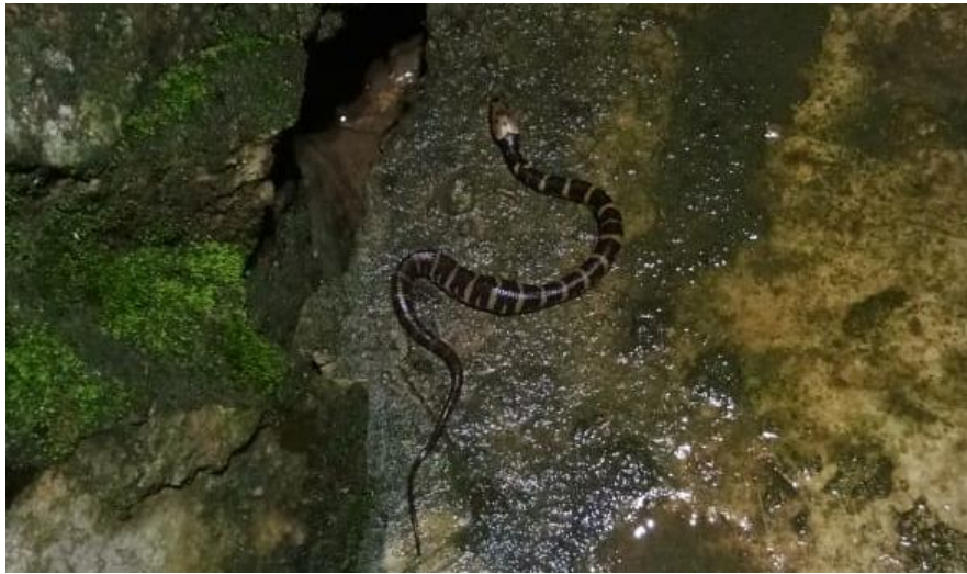
Gambar 2. Ular Kadut Belang ( Hemalopsis buccata ) Figure 2. Striped Cockroach Snake ( Hemalopsis buccata )

sama sekali tidak ditemukan karena habitat yang kering dan hanya dipenuhi oleh serasah dari daun- daun pohon sekitar.