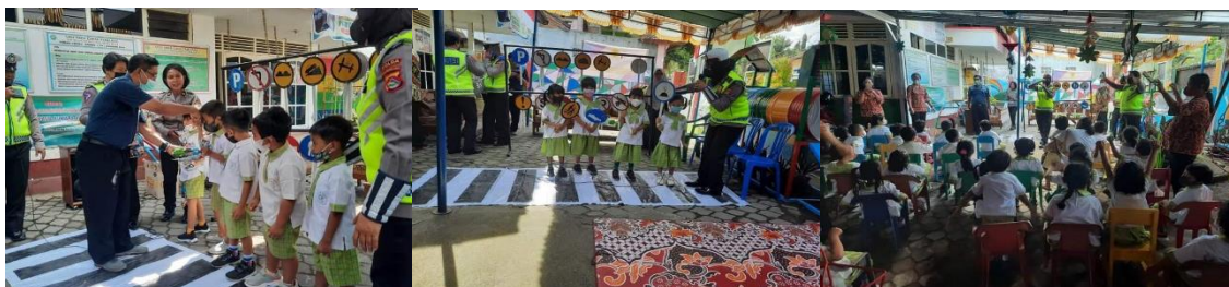
Gambar 3. Pengenalan Marka dan rambu dengan cara bermain

Metode bermain yang diterapkan dengan mengajak anak anak usia dini pada PAUD Kumara Asih untuk memancing peran aktif dan interaksi mereka dalam kegiatan. Menyiapkan hadiah bagi yang berani berinteraksi dalam permainan juga digunakan sebagai upaya bagaimana kegiatan tersebut menarik perhatian anak anak usia dini tanpa mengurangi muatan materi yang ingin di pahami anak anak dengan baik ( transfer of knowledgment ) khususnya dalam mengenali arti dan maksud dari fasilitas keselamatan yang ada di jalan raya. Mengajak mereka dengan mensimulasikan marka jalan buat menyebrang ( zebra cross ) misalnya juga untuk menguatkan pemahaman mereka terhadap fungsi dan manfaat fasilitas marka sebagai tempat meyebrang jalan yang aman. Dokumentasi pelaksanaan kegiatan disajikan pada Gambar 3 dan 4.