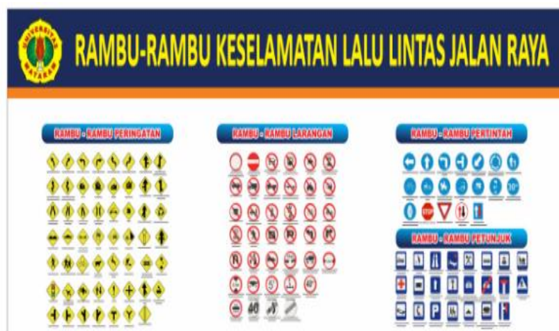
Gambar 1. Banner rambu terpasang dilokasi

Pelaksanaan kegiatan diawali dengan menyiapkan tim pelaksana dari Tim Pengabdian Fakultas Teknik Unram, koordinasi dengan lintas sector seperti tim Polda NTB, serta Tim Dinas Perhubungan Kota Mataram, dilanjutkan dengan menyiapkan alat peraga pelaksanaan kegiatan seperti contoh rambu, marka dan sebagainya yang akan dipasang di area sekolah PAUD Kumara Asih Kota Mataram. Berdasarkan hasil pelaksanaan koordiansi tim pelaksana dengan lintas sector Polda dan Dishub Kota Mataram, maka pelaksanaan kegiatan penyuluhan pada siswa PAUD Kumara Asih Kota Mataram dilakukan dengan melibatkan unsur Kepolisian dari Polda Nusa Tenggara Barat, Jajaran Direktorat Lalulintas Angkutan Jalan sebanyak 6 (enam) personal,, kemudian dari unsur Dinas Perhubungan Kota Mataram sebanyak 1 (satu) personil, dan dari Unsur Perguruan Tinggi Fakultas Teknik Universitas Mataram, Tim Pengabdian Fakultas Teknik Uqnam yang terdiri atas 5 orang dengan 1 ketua pelaksana dan 4 anggota.