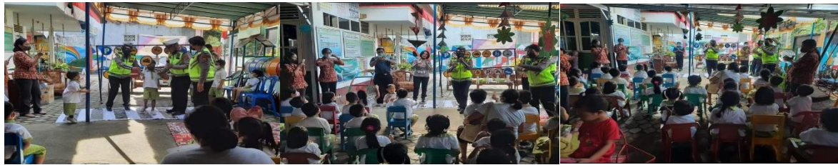
Gambar 4. Penerapan pola bermain dan memberi hadiah untuk memancing interaksi anak