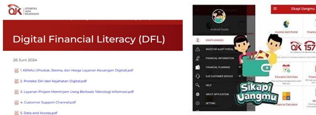
Gambar 2. Digital Financial Literacy