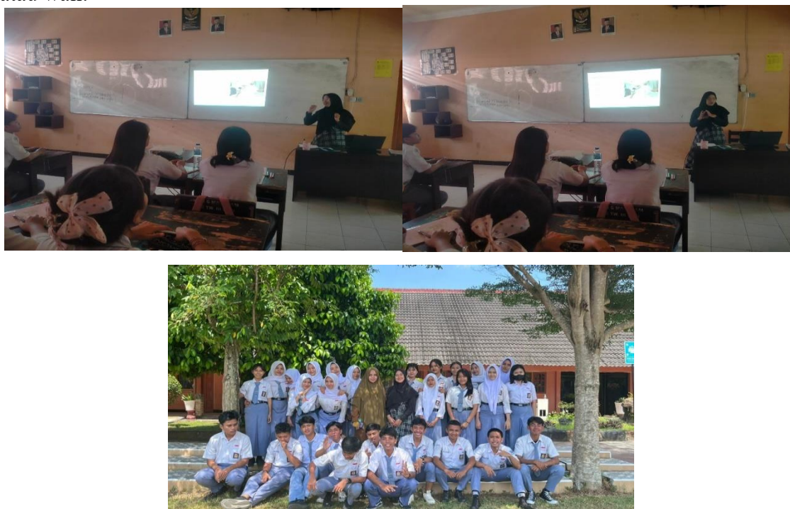
Gambar 4. Pelaksanaan kegiatan

Kegiatan diakhiri dengan membuka tanya jawab. Beberapa siswa memberikan pertanyaan untuk tim pengabdian diantaranya pilihan investasi yang tepat untuk Gen Z, serta bagaimana membagi investasi ke dalam beberapa jenis sesuai dengan dana yang mereka miliki yang tentu saja masih terbatas karena masih bergantung pada orang tua atau wali.