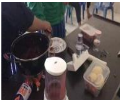
Gambar 3. Pembuatan selai stroberi secara langsung bersama peserta