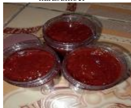
Gambar 4. Selai stroberi siap dikemas

Peserta sosialisasi dan pelatihan sangat antusias mengikuti kegiatan. Hal ini ditunjukkan dari berbagai pertanyaan yang diajukan peserta dan kehadiran peserta dari berbagai organisasi masyarakat serta peserta yang tetap focus dan mengikuti kegiatan hingga selesai. Pertanyaan yang diajukan peserta antara lain jenis kemasan yang tepat dan cara menempelkan label pada kemasan.