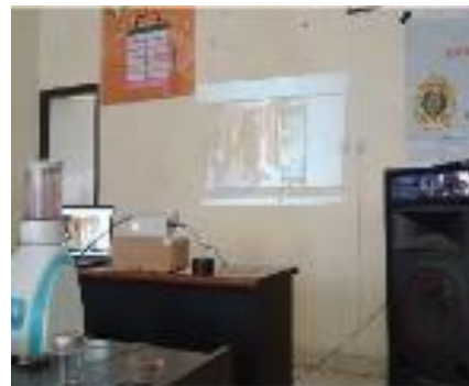
Gambar 2. Sosialisasi pelatihan dituntun via zoom meeting oleh narasumber