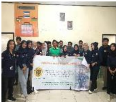
Gambar 1. Peserta sosialisasi dan pelatihan

Mutu selai sangat ditentukan oleh persentase gula, jenis bahan baku, dan jumlah asam yang diberikan ke bahan (Fadhillah et al. , 2023). Syarat mutu selai menurut SNI 3746:2008 sebagai berikut: warna, aroma, rasa adalah normal, serat buah positif, padatan terlarut minimal 65%, Cemaran logam timah (Sn) maksimal 250 mg/kg, Cemaran arsen (As) maksimal 1,0 mg/kg, Bakteri Koliform <3 APM/g, Staphylococcus aureus maksimal 2 \times 10^1 koloni/g, Clostridium sp. <10 koloni/g, Kapang dan khamir maksimal 5 \times 10^1 koloni/g.