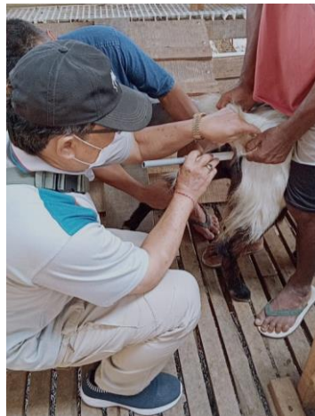
Gambar 3. Pemasangan spons-progesteron di dalam vagina kambing betina

Menurut Ridlo dan Budiyanto (2017), preparat spons mengandung medroxy progesterone acetate diinsersikan intra vaginal selama 14 hari (9 – 14 hari). Hal ini karena adanya variasi siklus estus yang tidak diketahui dari sekelompok ternak betina. Pada kegiatan pelatihan saat ini deposisi spons-progsteron di dalam vagina kambing dilakukan selama 9 hari dan pada hari ke-10 dilakukan pencabutan atau pengeluaran spons dari dalam vagina. Para peserta pelatihan diberikan waktu untuk mencoba sendiri proses ini, namun tetap dalam bimbingan. Pencabutan spons dilakukan dengan cara menarik tali benang secara perlahan-lahan agar tidak menyebabkan dinding vagina lecet. Apabila ada penahanan (kontraksi) saluran vagina, maka tarikan benang tidak dipaksakan tetapi hanya ditahan agar tidak masuk kembali dan penarikan dilanjutkan setelah kontraksi dinding vagina berhenti.