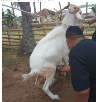
Gambar 6. Penampungan sperma dengan vagina buatan

Pengencer yang telah dibuat disimpan di dalam kulkas suhu 5°C hingga waktu pemakaian (maksimal satu minggu agar tidak rusak). Sebelum pelaksanaan IB, terlebih dahulu dilakukan penampungan (penadahan) sperma dari pejantan kambing terpilih (berkualitas baik). Selanjutnya dilakukan penampungan sperma dengan menggunakan vagina buatan (VB). Sperma segar hasil penampungan diperiksa secara makroskopis meliputi warna, bau, konsistensi, pH dan kadar debris di dalamnya. Berdasarkan konentensi dilakukan penaksiran persentase motilitas progresif dan konsentrasi spermatozoa hasil penampungan. Proses penampungan sperma disajikan pada Gambar 6.