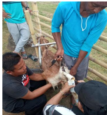
Gambar 7. Pelaksanaan inseminasi buatan : Memasukkan vaginoskop ke dalam vagina kambing birahi dan lampu dinyalakan, kemudian larutan sperma disemprotkan ke dalam serviks dengan menggunakan kateter IB dari plastic sheat yang dihubungkan dengan spuit 1 ml.

Catatan : IB dilakukan secara fix time insemination pada semua kambing hasil sinkronisasi estrus, baik yang terlihat tanda birahi ataupun tidak. Ada 2 ekor dari 8 ekor kambing yang digunakan saat kegiatan pelatihan tidak menunjukkan gejala birahi secara jelas, tetapi serviksnya sangat terbuka saat dimasuki kateter IB ( insemination gun ). Hal ini lumrah terjadi karena kemungkinan telah terjadi birahi tenang ( silent heat ), dimana terjadinya birahi tanpa menampakkan gejala visualis. Proses pelaksanaan IB dapat dilihat pada Gambar 7.