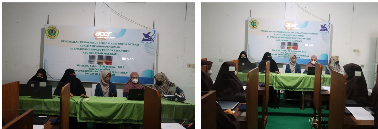
Gambar 2. Suasana penyampaian materi kemosensor.

Acara inti dari kegiatan pengabdian ini adalah pengenalan kemosensor untuk deteksi anion (Gambar 2). Pada sesi ini, kepada siswa diperkenalkan dengan ilmu kimia dan penerapannya, diperkenalkan dengan reaksi-reaksi kimia, salah satunya adalah reaksi sintesis. Siswa diperkenalkan bagaimana prosedur pelaksanaan sintesis di laboratorium. Siswa diperkenalkan prosedur mensintesis senyawa kemosensor. Siswa diperkenalkan prosedur melakukan uji kemosensor. Siswa diperkenalkan beberapa bentuk struktur senyawa kemosensor yang telah disintesis.