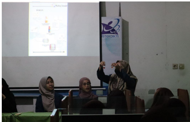
Gambar 4. Menunjukkan kepada siswa wujud dari senyawa sensor.

Kegiatan pengenalan kampus berisikan pemberian informasi kepada siswa seluk beluk kegiatan perkuliahan, mulai dari bagaimana mendaftar, bagaimana melaksanakan kegiatan perkuliahan, hingga bagaimana menyelesaikan tugas akhir. Harapannya ada dari siswa tersebut yang berminat untuk mendaftar masuk di FKIP. Terlihat antusiasme siswa menanggapi materi ini, terutama pada saat melakukan tanya jawab yang pada sesi ini lebih banyak dipegang oleh mahasiswa.