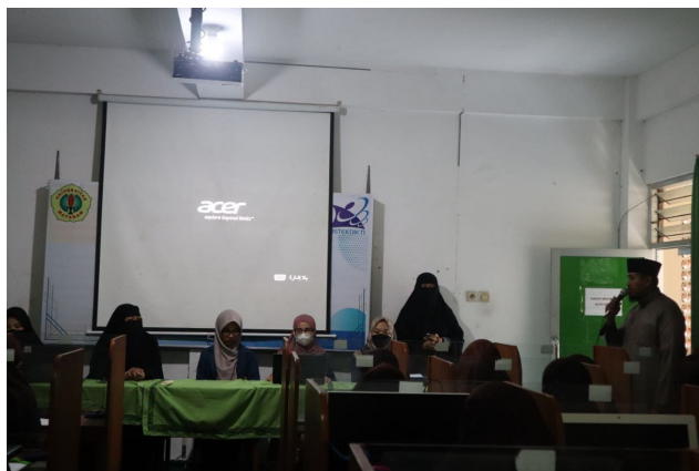
Gambar 1. Sambutan Kepala Sekolah

Kegiatan pengabdian ini dilaksanakan di SMAIT Abu Hurairoh Mataram, diikuti oleh 35 siswa kelas XII IPA, dan melibatkan 4 orang mahasiswa pendidikan kimia yang sedang tengah melakukan penelitian tugas akhir skripsi. Kegiatan ini dilaksanakan bersamaan dengan program bridging yang diselenggarakan oleh sekolah sehingga materi pengabdian melebar juga ke materi bridging .