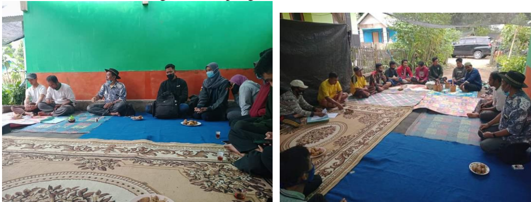
Gambar 1. Ceramah dan diskusi antara Tim dengan peserta (kelompok Tani)

Pada kegiatan pengabdian ini, sebelum dilakukan demonstrasi pembuatan pestisida nabati dari batang tembakau Virginia, peserta diberikan penjelasan umum tentang pengendalian hama kentang menggunakan pestisida nabati, termasuk pemanfaatan limbah batang tembakau Virginia. Anggota kelompok yang hadir sebagian besar unsur pemuda yang telah mulai menerapkan teknik alternative pengendalian hama dan beberapa orang telah menerapkan budidaya pertanian organic. Para peserta diskusi sangat bersemangat mendengarkan dan mencermati penyampaian materi yang dibawakan oleh Tim. Di samping dapat dilihat dari kehadiran peserta, juga dari interaksi peserta dengan Tim selama diskusi, para peserta banyak menanyakan hal hal yang berkaitan dengan pengalaman mereka di lapangan, terutama berkaitan dengan teknik pengendalian hama