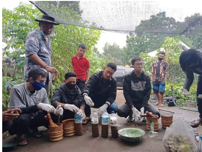
Gambar 2. Proses Pembuatan Larutan dasar Pestisida dari limbah batang tembakau Virginia