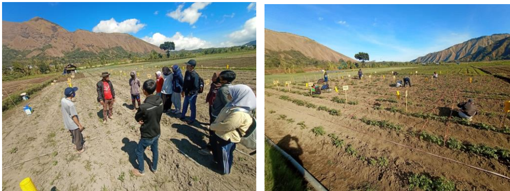
Gambar3. Persiapan penanaman kentang