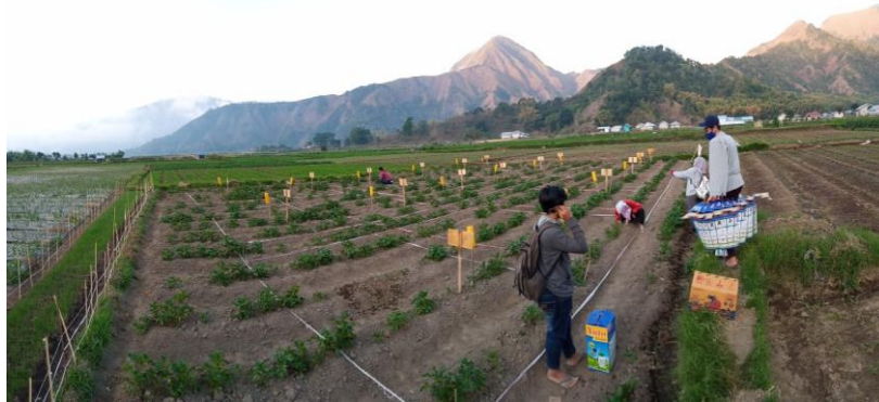
Gambar 6 : Persiapan Penyemprotan sehari sebelum pengamatan