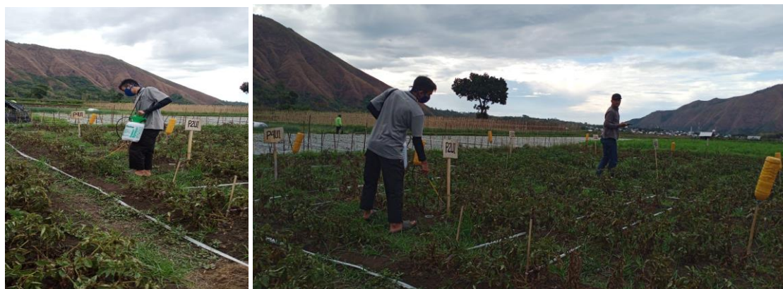
Gambar 5. Penyemprotan tanaman menggunakan petisida nabati