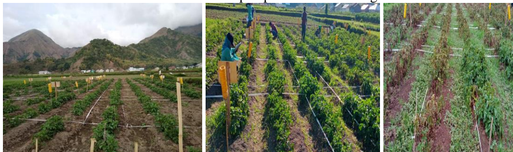
Gambar 4. Pemeliharaan tanaman dan Pengamatan hama