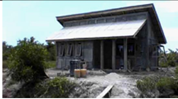
Gambar 6. Bangunan sudah selesai dikerjakan