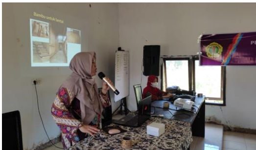
Gambar 1. Pemaparan Materi

Kegiatan pengabdian kepada masyarakat Desa Rembitan berupa penyuluhan dan pelatihan telah dilaksanakan pada hari Kamis tanggal 9 September 2021 jam 10.00 wita bertempat di gedung aula Kantor Desa Rembitan. Hadir dalam kegiatan tersebut Bapak Kepala Desa, Sekretaris Desa beserta perangkat desa. Dalam kegiatan tersebut hadir pula beberapa kepala dusun dan tokoh masyarakat. Sebagian besar peserta yang hadir memiliki mata pencaharian sebagai tukang bangunan.