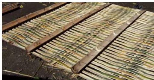
Gambar 7. Pemasangan kolom pada anyaman dinding