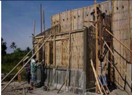
Gambar 5. Bangunan dalam proses konstruksi