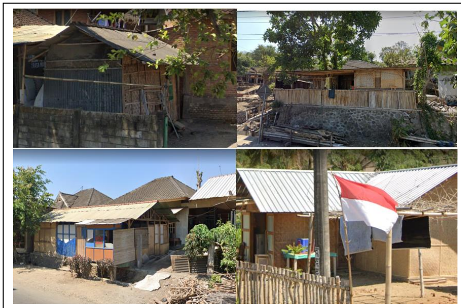
Gambar 1. Ragam Pemanfaatan Bambu di Desa Rembitan

Pergeseran penggunaan bambu sebagai material rumah menjadi rumah bata lebih banyak dilatarbelakangi oleh kurangnya pemahaman tentang tata cara memanfaatkan bambu agar dapat memiliki usia lebih panjang dan dengan tampilan menarik layaknya rumah yang berkonstruksi batu bata. Konstruksi bambu plester belum banyak dikenal. Keberadaannya menjadi langka karena masyarakat banyak yang belum mengetahui kelebihan konstruksi ini. Padahal menurut hasil penelitian, konstruksi bambu plester selain harganya lebih murah, bertahan lama juga tahan gempa. Kuat lentur bambu yang tinggi menjadikan bambu lebih daktail ketika menerima beban, serta merupakan material yang sangat ringan sehingga bambu cocok sebagai material bangunan untuk wilayah rawan gempa (Noverma, Asri Sawiji, Oktavi Elok Hapsari 2018 dalam Noverma dkk, 2018).