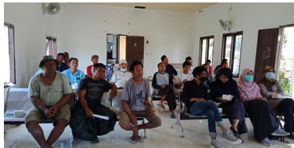
Gambar 2. Peserta yang Menghadiri kegiatan Sebagian Bermatapencaharian sebagai Tukang Bangunan