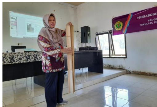
Gambar 4. Penjelasan tentang Perakitan Bambu untuk Kolom dan cara perkuatannya

Materi kegiatan pengabdian di Desa Rembitan ini membahas tentang konstruksi rumah berdinding bambu plester. Yang mana pada dasarnya rumah bambu plester adalah merupakan bangunan rumah dengan bahan bambu sebagai salah satu penyusun elemen konstruksinya. Bagian dindingnya berupa anyaman bambu yang dilapis dengan plesteran hasil campuran pasir, semen dan air. Tujuan pelapisan adalah untuk menambah kekuatan dinding, juga untuk memberi tampilan sebagai dinding tembok. Gambar 5 dan 6 memberikan ilustrasi saat fase konstruksi rumah bambu plester dan saat bangunan sudah selesai dikerjakan.