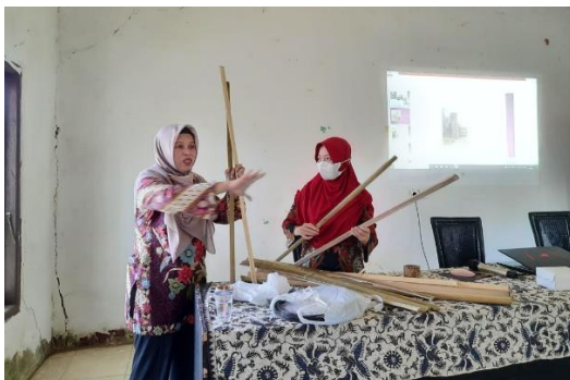
Gambar 3. Sesi Pelatihan