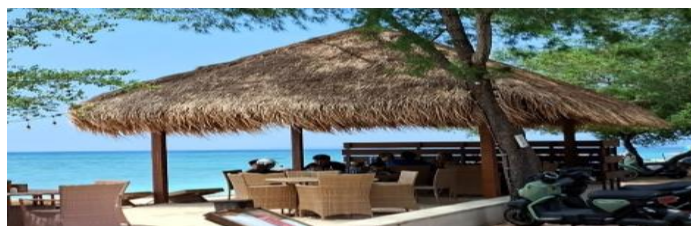
Gambar 4.9 Contoh Bangunan dengan Bentuk Menyerupai Berugak atau Lumbung Tradisional

Representasi lokal juga ditemukan pada beberapa akomodasi yang menggunakan bentuk bangunan menyerupai berugak atau lumbung tradisional Lombok. Bentuk bangunan tersebut dicirikan oleh penggunaan atap yang menjulang, material alami, serta ruang terbuka yang memungkinkan interaksi langsung dengan lingkungan sekitar.