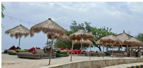
Gambar 1.3 Representasi identitas lokal melalui unsur visual dan arsitektural pada ruang publik wisata di Gili Trawangan

Sasak itu sendiri. Dengan demikian, ruang publik wisata menjadi arena pertemuan antara identitas global dan identitas lokal. Di satu sisi, bahasa asing digunakan untuk menjangkau wisatawan internasional dan membangun citra global (Izzati dkk (2026). Namun, di sisi lain, unsur visual lokal tetap dipertahankan sebagai penanda budaya dan daya tarik wisata. Pandangan tersebut sejalan dengan konsep multimodal dari Kress dan van Leeuwen (2021) yang melihat bahwa berbagai mode semiotik, termasuk visual dan arsitektural, dapat berfungsi dalam membangun makna sosial dan identitas budaya dalam ruang publik.