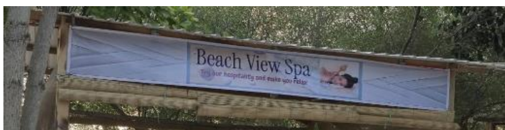
Gambar 4.2 Beach View Spa

Dominasi tersebut dapat dilihat pada papan nama Beach View Spa yang menggunakan bahasa Inggris secara penuh. Papan nama tersebut memuat slogan Try our hospitality and make you relax tanpa disertai bahasa lain.