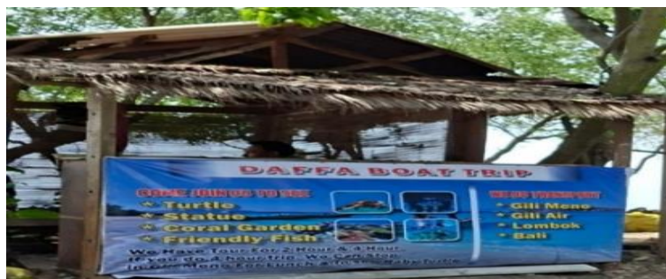
Gambar 4.6 Daffa Boat Trip

Kata lolita berasal dari bahasa Spanyol yang berarti 'gadis muda' dan digunakan sebagai identitas usaha. Sementara itu, frasa Best Mexican Resto & Bar menggunakan bahasa Inggris untuk menjelaskan jenis layanan yang ditawarkan. Kehadiran bahasa Spanyol pada data tersebut menunjukkan adanya keragaman bahasa dalam ruang publik wisata Gili Trawangan. Namun, bahasa Inggris tetap menjadi bahasa utama yang menjelaskan fungsi dan layanan usaha. Dengan kata lain, bahasa lain digunakan untuk membangun identitas tertentu, sedangkan bahasa Inggris tetap berperan sebagai bahasa komunikasi utama. Pola yang sama juga terlihat pada kategori nama diri-Inggris. Salah satu contohnya adalah papan nama Daffa Boat Trip.