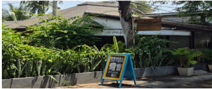
Gambar 4.7 Bale Sampan Bungalows & Taste Cafe Resto

Salah satu contoh dapat dilihat pada akomodasi Bale Sampan Bungalows & Taste Cafe Resto.