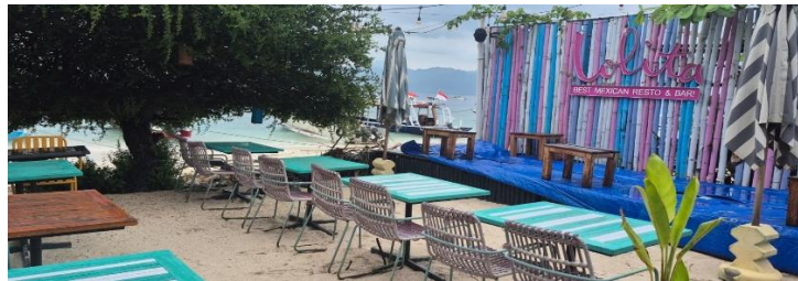
Gambar 4.5 Lolita: Best Mexican Resto & Bar!

Selain bahasa Indonesia dan bahasa Sasak, ditemukan pula penggunaan bahasa asing lain seperti bahasa Spanyol. Salah satu contoh yang ditemukan adalah papan nama Lolita.