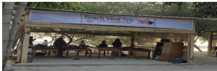
Gambar 4.8 Bentuk Bangunan Beach View Spa

Pada data tersebut, penggunaan kata bale yang berarti rumah diperkuat oleh tampilan bangunan yang menggunakan bambu dan material kayu. Bentuk bangunannya tidak menampilkan gaya arsitektur modern yang tertutup, tetapi lebih menyerupai rumah atau bangunan tradisional yang terbuka. Hubungan antara unsur linguistik dan visual tersebut menunjukkan bahwa identitas lokal tidak hanya dibangun melalui bahasa, tetapi juga melalui bentuk fisik bangunan yang hadir dalam ruang wisata.