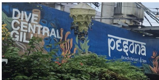
Gambar 4.3 Dive Central Gili di Pesona Beach Resort & Spa

Dominasi bahasa Inggris juga tampak pada data bilingual Indonesia-Inggris. Salah satu contohnya adalah papan nama Dive Central Gili di Pesona Beach Resort & Spa.