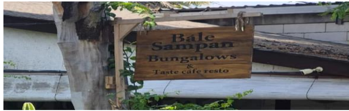
Gambar 4.4 Bale Sampan Bungalows & Taste Cafe Resto

Dalam bahasa Sasak, kata bale berarti 'rumah' dan sampan berarti 'perahu'. Namun, unsur bahasa Sasak hanya muncul pada nama usaha, sedangkan informasi lainnya didominasi oleh bahasa Inggris. Temuan ini menunjukkan bahwa bahasa Sasak memiliki visibilitas yang sangat terbatas dalam lanskap linguistik Gili Trawangan. Bahasa Sasak lebih banyak digunakan sebagai penanda identitas lokal dibandingkan sebagai sarana komunikasi dalam ruang publik wisata.