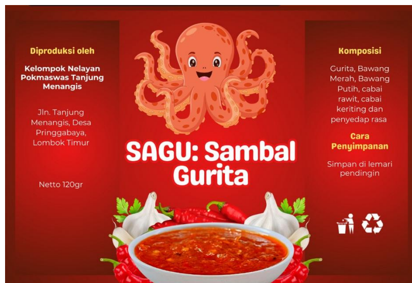
Gambar 5. Desain Kemasan Menggunakan Canva

Selain teknik pengemasan dilakukan juga pemberian pelatihan menggunakan aplikasi canva untuk melakukan desain kemasan. Canva merupakan salah satu alat untuk melakukan desain dan dapat digunakan secara gratis melalui website. Menurut Rahmat & Anastasia (2023), desain menjadi faktor penting dalam penjualan produk karena berfungsi sebagai cara dalam menyampaikan informasi produk kepada konsumen, selain itu desain juga dapat menjadi daya tarik bagi konsumen dan meyakinkan konsumen untuk membeli. Kemasan menjadi identitas produk sehingga harus bisa menggambarkan isi dari produk yang ada didalamnya (Willy & Nurjanah, 2019).