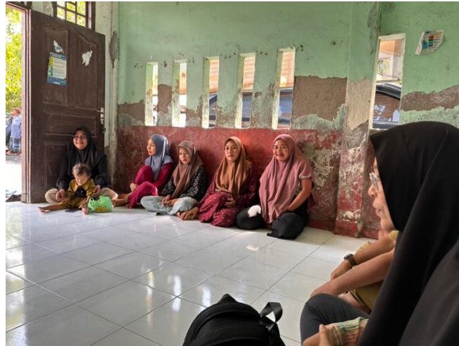
Gambar 2. FGD dengan Masyarakat

yaitu terkait pemanfaatan teknologi induksi sealer. Dari hasil diskusi, didapatkan bahwa masyarakat masih belum mengetahui teknologi pengemasan menggunakan induksi sealer. Saat ini pengemasan yang dilakukan oleh masyarakat hanya menggunakan kemasan plastik, sehingga ketahanan produk pangan tidak bertahan lama. Selain itu diberikan juga materi terkait sterilisasi alat yang akan digunakan. Tujuan dari sterilisasi adalah untuk mematikan mikroorganisme. Menurut Azhari et al. (2023), suhu tinggi diatas 100 C mampu membunuh spora bakteri. Oleh sebab itu dengan melakukan sterilisasi pada botol kaca sebagai wadah sambal, mampu menghasilkan kualitas yang lebih baik.