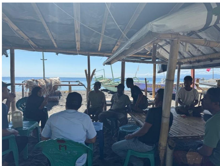
Gambar 1. Survei Lokasi Kegiatan di Pantai Ketapang, Desa Pringgabaya

Koordinasi terkait bahan berupa gurita juga dilakukan ditahap ini, dimana semua alat dan bahan telah disiapkan oleh tim pengabdian sedangkan khusus gurita disediakan oleh masyarakat di Desa Pringgabaya yang merupakan hasil tangkapan mereka. Berat rata-rata gurita yang ditangkap oleh nelayan yaitu 1-2 kg per ekor. Gurita kemudian diolah dengan cara dikukus menggunakan pressure cooker . Hal ini bertujuan untuk mengempukkan daging gurita. Menurut Rahmadani et al. (2025), pemasakan dengan 30 menit mampu menghasilkan daging gurita yang empuk. Gurita diketahui memiliki ikatan jaringan yang kuat, sehingga tanpa penggunaan pressure cooker membuat produk menjadi keras. Pada proses pegempukan daging gurita sebenarnya dapat dilakukan dengan beberapa cara seperti pembekuan (Mouritsen dan Styrbak, 2018) dan penggunaan enzim protease (Aoyama et al. , 2016). Dalam kegiatan ini sendiri penggunaan pressure cooker dirasa lebih cocok karena alat yang digunakan mudah ditemukan dan membutuhkan waktu yang lebih cepat.