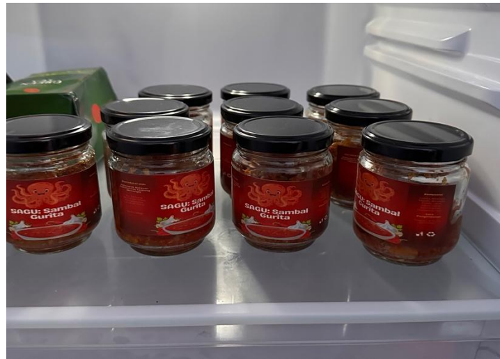
Gambar 4. Sambal Gurita yang Telah Dikemas

udara. Prinsip kerja dari induksi sealer adalah mesin induksi menghantarkan panas pada aluminium foil yang berfungsi sebagai penutup botol. Menurut Diana et al. (2021), sambal sunti yang dikemas dengan teknik induksi sealer mampu menghasilkan produk yang awet selama 4 bulan, dibandingkan dengan sambal sunti yang dikemas tanpa induksi sealer hanya mampu bertahan selama 3 minggu.