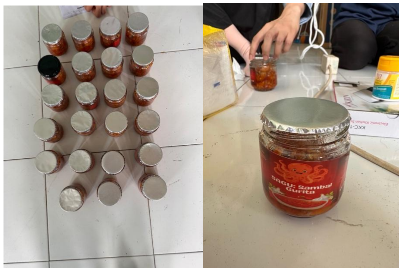
Gambar 3. Sambal Gurita yang Dikemas dengan Induksi Sealer

Setelah pemberian materi dengan metode FGD, kemudian dilanjutkan dengan pelaksanaan kegiatan pembuatan sambal. Gurita yang telah dimasak lalu dicampurkan dengan cabai, bawang, merah, bawang putih, dan daun jeruk. Dalam pembuatan sambal diberikan juga minyak goreng untuk menumis. Penggunaan minyak sendiri dapat berperan dalam menjaga kualitas sambal. Hal ini disebabkan minyak mengandung monogliserida yang mampu menghambat aktivitas bakteri melalui pengrusakan membran (Wang et al. , 2020).