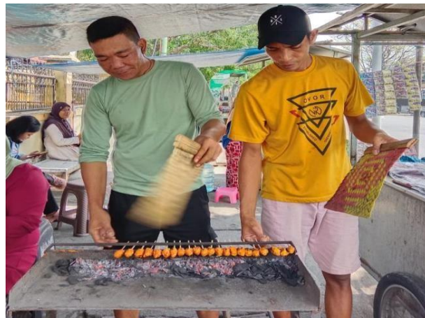
Gambar 2 Proses pemanggangan sate ikan laut Tanjung

Bumbu-bumbu tersebut dihaluskan dan dicampur dengan santan, santan sendiri sangat berperan penting dalam membantu melembutkan tekstur sate ikan. Setelah adonan bumbu dan ikan dicampur dibentuk melilit pada tusuk bambu sepanjang sekitar 15-20 cm dan dipadatkan. Proses pemanggangan dilakukan di atas bara arang batok kelapa dengan panas sedang selama kurang lebih 5-10 menit sembari dibolak-balik agar matang merata tanpa gosong. Berdasarkan hasil pengamatan penggunaan arang batok kelapa menghasilkan aroma asap yang khas dan memberikan cita rasa gurih serta tekstur lembut pada daging ikan. Adapun diagram alir proses pengolahan sate ikan laut tanjung dapat dilihat pada Gambar 3.