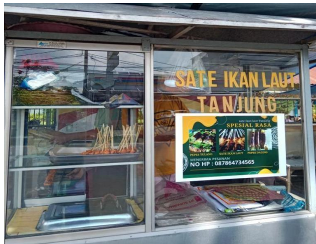
Gambar 1 Lapak sate ikan laut Tanjung spesial rasa

Sate ikan laut Tanjung merupakan sate ikan yang umumnya dijumpai di sekitar wilayah anjung, Kabupaten Lombok Utara, Nusa Tenggara Barat. Sate ikan laut Tanjung dijual dengan memanfaatkan pelataran kios-kios di pinggir jalan maupun dengan membangun tenda di bahu jalan sehingga sate ikan Laut Tanjung sangat mudah di temui di sekitar Lombok Utara atau bahkan di Kota Mataram sendiri. Pada penelitian ini kami mengunjungi salah satu penjual sate ikan Laut Tanjung di daerah Mataram yaitu sate ikan Laut Tanjung Spesial Rasa yang berlokasi di Jl. Bung Karno, Pagutan Timur., Kec. Mataram. Sate ikan Laut Tanjung Spesial Rasa sudah berjualan sejak tahun 2013. Resep sate ikan laut Tanjung Spesial Rasa didapatkan secara turun temurun dari keluarga, namun jika dibandingkan dengan sate tanjung pada tempat lain, bahan dan rempah-rempah yang digunakan umumnya sama saja. Pada sate tanjung spesial rasa sendiri menjual sate dengan harga Rp10.000,- per 6 tusuk sate dan terdapat pelengkap seperti lontong atau ketupat yang dapat menjadi opsional sumber karbohidrat. Lontong di jual Rp1.000,-per 1 pcs dan ketupat seharga Rp2.000,-per pcs.