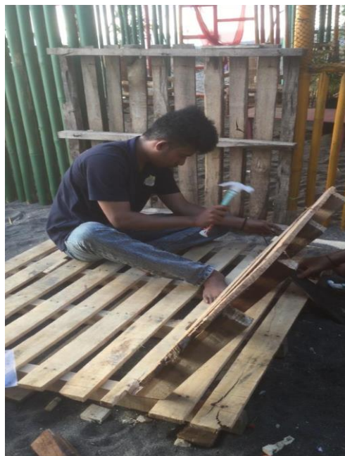
Gambar 7. Pembuatan kursi untuk pengunjung Pantai Napak Tilas