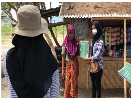
Gambar 4. Penyuluhan sampah kepada warung-warung di Pantai Napak Tilas

selebaran menggunakan strategi door to door yaitu mendatangi langsung warung-warung di Pantai Napak Tilas. Strategi tersebut digunakan karena kondisi pandemi yang tidak memperbolehkan adanya kerumunan. Namun karena waktu yang terbatas, kegiatan ini tidak dapat menjangkau semua masyarakat yang berjualan di Pantai Napak Tilas.