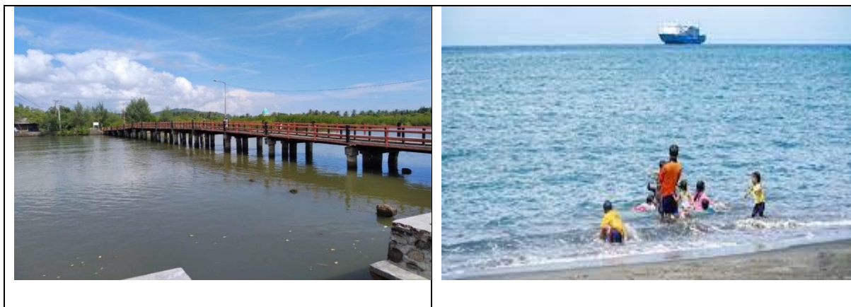
Gambar 2. Jembatan dan Suasana Pantai Napak Tilas