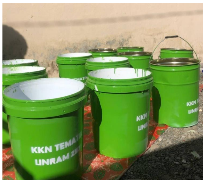
Gambar 5. Pembuatan bak sampah

Berkaitan dengan terciptanya kawasan wisata pantai yang indah dan bersih kami membuat bak sampah untuk diletakkan pada beberapa spot di Pantai Napak Tilas. Hal tersebut dilakukan karena di Pantai Napak Tilas ketersediaan bak sampah masih kurang. Melalui sarana ini diharapkan mampu mengurangi jumlah sampah yang dibuang sembarangan di pantai. Bak sampah yang dibuat memiliki ukuran yang pas dan dapat dipindahkan. Namun karena jumlah yang sedikit maka belum efektif untuk mengurangi jumlah sampah sepenuhnya.