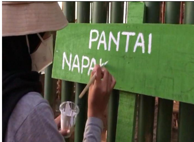
Gambar 6. Pembuatan papan penunjuk arah Pantai Napak Tilas

Selain itu, kami juga membuat sarana berupa kursi untuk pengunjung pantai. Kelebihan kursi kayu antara lain ramah lingkungan, dan sederhana. Namun, kursi yang terbuat dari kayu mudah lapuk dan digerogeti oleh rayap.