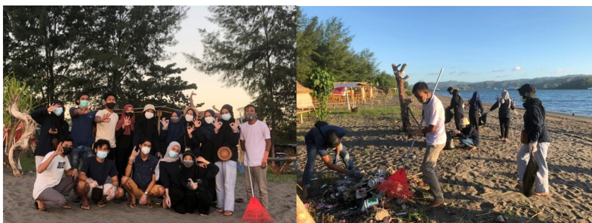
Gambar 3. Napak Tilas clean up bersama Pokdarwis

Disamping itu, walaupun sudah ada imbauan tegas dari pemerintah daerah dan pihak-pihak terkait protokol Covid-19, nyatanya wisatawan dan pendatang lainnya seperti pedagang keliling belum sepenuhnya mengindahkan dan masih ada yang mengabaikan. Bahkan ada beberapa penjual di pantai tidak mengenakan masker. Namun, pengelola objek wisata Pantai Napak Tilas tetap berupaya memperketat penerapan protokol kesehatan. Didalam area pantai tampak setiap pedagang menyediakan tempat untuk mencuci tangan atau handsanitizer guna mencegah penularan Covid-19.