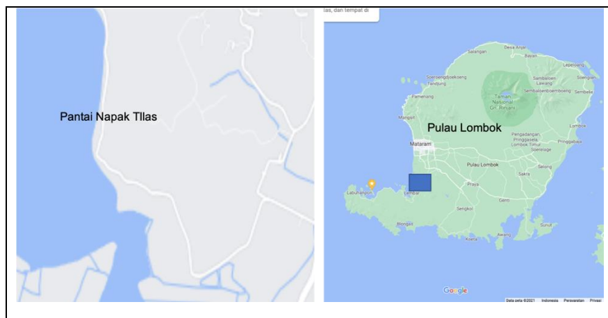
Gambar 1. Lokasi Desa Lembar Selatan dan Pantai Napak Tilas.

Pantai Napak Tilas terletak di Desa Lembar Selatan, Kecamatan Lembar Kabupaten Lombok Barat. Pantai ini selain memiliki ombak yang tenang juga memiliki pemandangan yang unik yang tidak terdapat pada objek wisata lain karena dilintasi kapal-kapal besar, dan memiliki pohon cemara yang rindang. Namun kondisi objek wisata saat ini mengalami kerusakan karena lokasi wisata yang tidak terbebas dari sampah. Fasilitas penunjang wisata sebagai pemenuhan kebutuhan dasar wisatawan masih kurang. Prasarana jalan menuju lokasi wisata sudah tersedia namun kondisinya kurang baik. Jembatan kayu yang merupakan satu-satunya akses untuk menuju pantai ini juga dalam kondisi yang kurang baik. Namun demikian, Pemerintah Desa sudah ada rencana untuk memperbaiki.