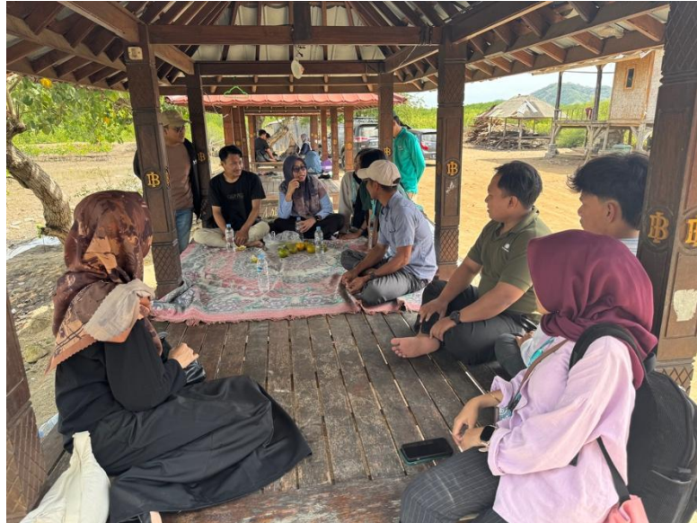
Gambar 1. Kegiatan Survei kebutuhan POKDARWIS Bagek Kembar

Pelaksanaan pengabdian diawali dengan survei lapangan untuk mengamati kondisi kawasan, mengidentifikasi kebutuhan mitra, serta menentukan materi penyuluhan yang sesuai dengan potensi dan permasalahan yang dihadapi (Sari et al., 2026; Hilyana et al., 2023). Hasil survei tersebut menjadi dasar dalam penyusunan kegiatan penyuluhan (Gambar 1).