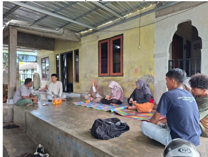
Gambar 1. Sosialisasi literasi keuangan digital

Berdasarkan hasil diskusi diketahui bahwa peserta belum mencatat keuangan usaha dengan rapi dan belum dapat memisahkan keuangan rumah tangga dengan usaha budidaya. Informasi dan pengetahuan terkait pengelolaan keuangan masih belum sampai ke masyarakat peisir menjadi kendala utama pelaku usaha budidaya dalam menjalankan usaha secara profesional. Melalui kegiatan sosialisasi, peserta mulai memahami pentingnya literasi keuangan digital dalam mendukung keberlanjutan usaha. Literasi keuangan membantu pelaku usaha meningkatkan kemampuan pengelolaan keuangan, perencanaan usaha, dan pengambilan keputusan ekonomi secara lebih tepat.