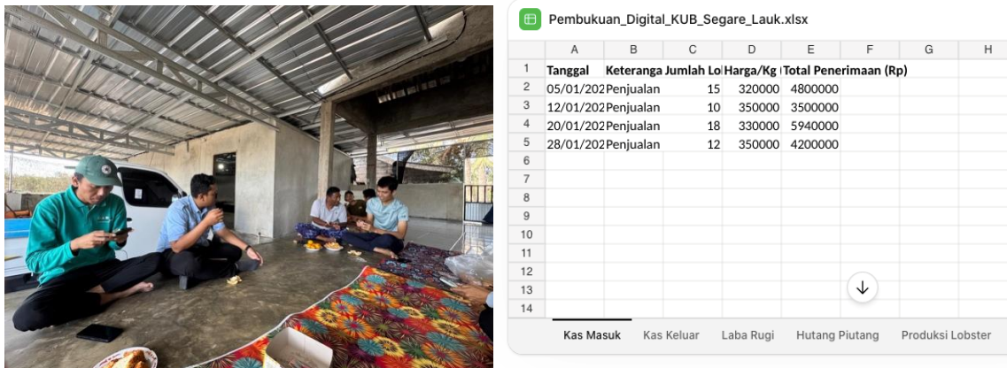
Gambar 2. Pengenalan excel dan aplikasi SI APIK

Pendampingan dilakukan untuk memastikan peserta dapat menggunakan aplikasi secara berkelanjutan. Selama proses pendampingan, peserta mampu memisahkan transaksi usaha dan pribadi serta mulai belajar menyusun laporan keuangan sederhana. Kegiatan ini memberikan dampak positif terhadap peningkatan kapasitas kelompok dalam pengelolaan usaha secara online. Wardiningsih et al., (2025) menyebutkan bahwa pendampingan penggunaan pembukuan digital mampu memperkuat literasi keuangan dan mengembangkan kemampuan pelaku usaha dalam mengelola keuangan secara sistematis dan transparan.