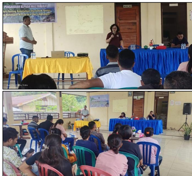
Gambar 2. Penyampaian materi kepada peserta kegiatan

Penyampaian materi dilakukan secara sistematis dan komunikatif dengan menggunakan bahasa yang mudah dipahami oleh masyarakat. Materi disajikan secara bertahap dimulai dari pengenalan konsep dasar ekosistem pesisir, dilanjutkan dengan penjelasan mengenai ekosistem mangrove, fungsi ekologis dan ekonomis, serta peran mangrove dalam menjaga keseimbangan lingkungan. Selain itu, disampaikan pula dampak aktivitas manusia terhadap ekosistem mangrove, seperti penebangan, pencemaran, dan perubahan penggunaan lahan (Gambar 2).