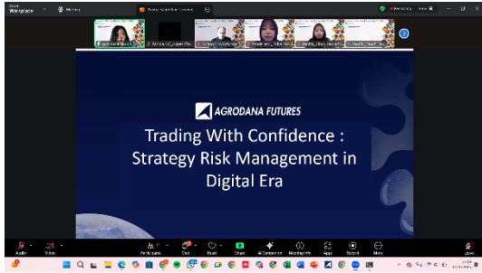
Gambar 1. Pemaparan materi ketiga

Pada sesi pemaparan materi ketiga ini, dijelaskan bahwa PT Agrodana Futures sudah terjamin legalitasnya karena resmi diawasi oleh Pengawas Perdagangan Berjangka Komoditi (BAPPEBTI), Otoritas Jasa Keuangan (OJK), dan Bank Indonesia (BI). Legalitas ditekankan agar mahasiswa dan masyarakat umum paham dan waspada agar terhindar dari investasi ilegal yang sangat merugikan. Total produk yang ditawarkan PT Agrodana Futures kurang lebih 80 produk, yang terdiri dari Forex, Komoditi, Indeks Saham, dan Saham Tunggal US.