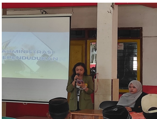
Gambar 1. Suasana Sosialisasi Adminduk

Sosialisasi dilaksanakan pada Senin, 28 Agustus 2025 di Balai Desa Plalangan, dimulai pukul 09.00 hingga 12.00 WIB. Sebanyak 33 orang hadir sebagai peserta, terdiri atas tokoh masyarakat serta warga desa, didampingi oleh 12 mahasiswa sebagai panitia pelaksana. Suasana sosialisasi dapat dilihat pada Gambar 1.