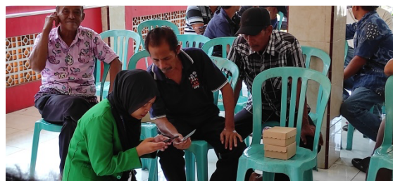
Gambar 3. Pendampingan Adminkuk Aplikasi J-SIP

kunjungan rumah maupun layanan terbuka di posko KKN.