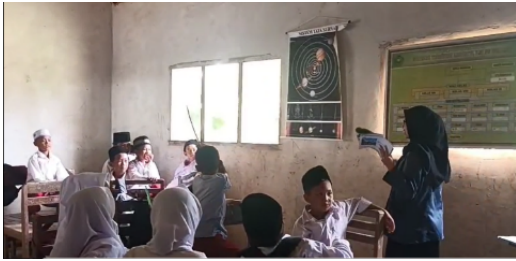
Gambar 5. Bacakan Saya Buku