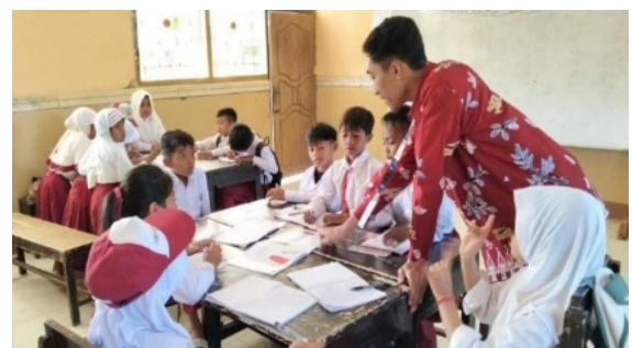
Gambar 8. Cerdas Mengulas Buku

Selain itu, kegiatan ini juga menjadi wadah bagi siswa untuk berbagi pengalaman membaca dengan teman-temannya, sehingga tercipta suasana belajar yang interaktif dan menyenangkan. Guru maupun pembimbing turut memberikan arahan serta apresiasi terhadap hasil ulasan yang disampaikan siswa, sehingga motivasi mereka untuk terus membaca semakin tumbuh. Dengan adanya kegiatan Cerdas Mengulas Buku, diharapkan budaya literasi di sekolah dapat semakin kuat dan berkelanjutan.