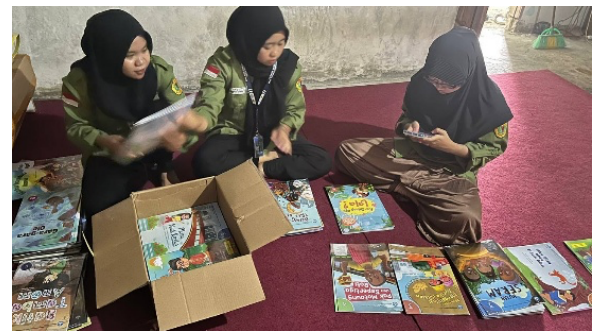
Gambar 4. Pengelolaan Perpustakaan