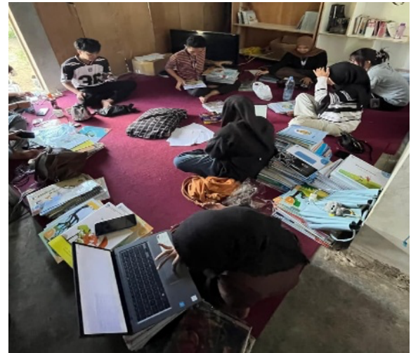
Gambar 3. Pengelolaan Perpustakaan

mampu mendukung kebutuhan belajar dan membaca masyarakat secara berkelanjutan.