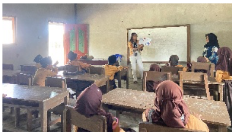
Gambar 12. Kunjungan Literasi Ke Sekolah