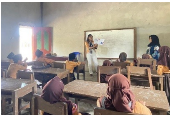
Gambar 7. Membaca Nyaring

Kegiatan Membaca Nyaring dilaksanakan setiap kali kunjungan ke sekolah sebagai salah satu upaya untuk menumbuhkan minat baca peserta didik. Dalam kegiatan ini, guru atau pendamping membacakan buku cerita secara lantang, jelas, dan penuh ekspresi agar siswa lebih mudah memahami isi bacaan serta merasakan suasana yang menyenangkan saat membaca. Dengan cara ini, anak-anak tidak hanya mendengar alur cerita, tetapi juga belajar mengenali kosakata baru, intonasi, serta makna yang terkandung di dalam bacaan.