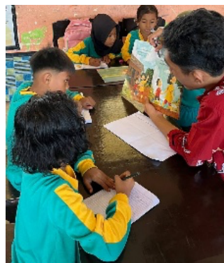
Gambar 10. Membuat Cerita Berbasis Buku Bacaan

Selain itu, kegiatan ini juga bertujuan menumbuhkan minat baca siswa melalui pengalaman menulis yang menyenangkan. Dengan menulis cerita dari buku bacaan, siswa tidak hanya memahami isi bacaan, tetapi juga belajar mengembangkan imajinasi, kreativitas, dan keterampilan menulis yang baik. Hal ini diharapkan dapat meningkatkan budaya literasi di sekolah sekaligus membiasakan siswa untuk lebih aktif dalam kegiatan membaca dan menulis.