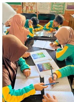
Gambar 11. Membuat Cerita Berbasis Buku Bacaan