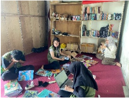
Gambar 1. Pendataan Perpustakaan