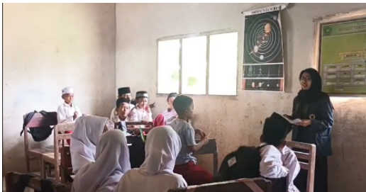
Gambar 6. Bacakan Saya Buku