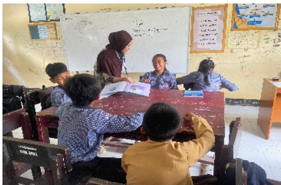
Gambar 9. Membuat Proyek Berbasis Buku Bacaan

Proyek yang dihasilkan dapat berupa poster, rangkuman kreatif, presentasi, hingga karya seni yang menggambarkan isi buku. Dengan cara ini, siswa tidak hanya membaca secara pasif, tetapi juga mampu mengembangkan ide, menuangkan gagasan, dan menyajikan hasil bacaan dalam bentuk yang lebih nyata. Melalui kegiatan ini, pembelajaran menjadi lebih bermakna sekaligus melatih keterampilan komunikasi, kolaborasi, dan kreativitas siswa.