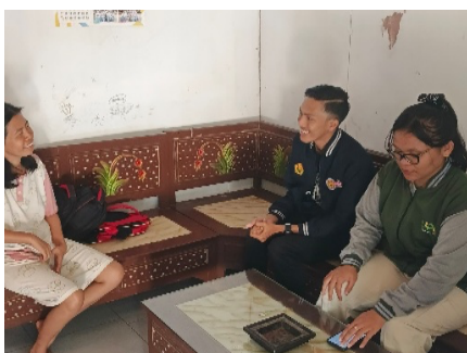
Gambar 2. Pendataan ATS