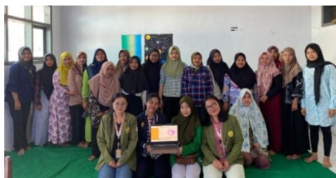
Gambar 1. Sosialisasi Adminduk

dengan sesi tanya jawab untuk memastikan pemahaman.