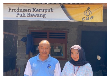
Gambar 7. Survei UMKM Desa