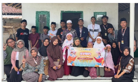
Gambar 6. Pelaksanaan RUMPI