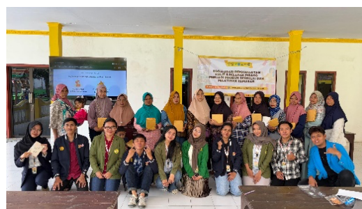
Gambar 8. Pelaksanaan Sosialisasi Teknik Analisis Keberhasilan Program

Keberhasilan program KKN diukur melalui kombinasi metode kualitatif dan kuantitatif. Metode kualitatif meliputi observasi partisipasi dan antusiasme masyarakat, wawancara mendalam dengan perangkat desa, tokoh masyarakat, dan penerima manfaat, serta diskusi kelompok terarah (FGD) untuk menggali persepsi dan perubahan perilaku. Metode