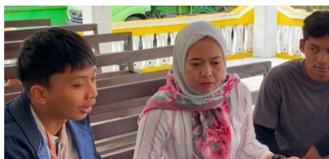
Gambar 3. Pendampingan Infografis