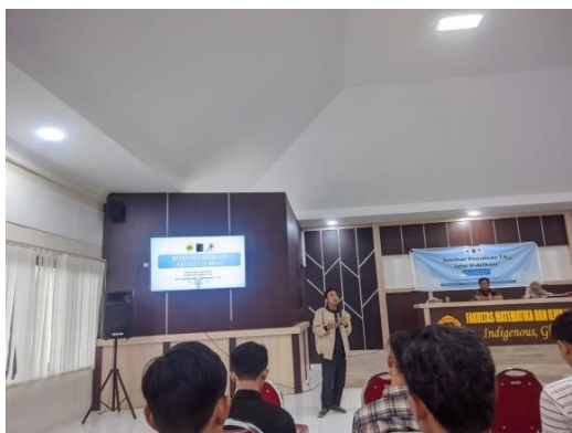
Gambar 3. Penyampaian Materi oleh Narasumber kedua

bahwa tugas akhir dengan tujuan publikasi lebih efisien. Beberapa keuntungan yang diperoleh dengan menyelesaikan tugas akhir antara lain dampak lebih cepat, aksesibilitas pengetahuan, lebih luas dan fokus, serta peluang kolaborasi. Selain itu, dijelaskan juga bahwa penelitian dengan melakukan publikasi ilmiah akan sangat berguna jika mahasiswa ingin melanjutkan studi.