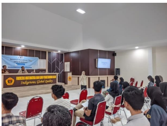
Gambar 1. Penyampaian Materi oleh Narasumber Pertama

Narasumber pertama dalam diskusi ini membahas secara rinci tentang ulasan materi yang disampaikan oleh Menteri Pendidikan. Dalam ulasannya, Menteri Pendidikan telah mengambil keputusan terkait dengan kewajiban pengambilan skripsi. Keputusan tersebut memiliki implikasi besar dalam dunia pendidikan tinggi, karena tugas akhir pengganti skripsi adalah topik yang penting dan relevan untuk mahasiswa di berbagai program studi. Diskusi ini mencakup berbagai sudut pandang dan perdebatan terkait dengan kebijakan tersebut, membantu pendengar untuk memahami dampaknya secara lebih mendalam.