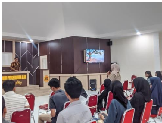
Gambar 4. Sesi Tanya Jawab

Setelah penyampaian materi, rangkaian acara selanjutnya adalah tanya jawab. Peserta mengajukan beberapa pertanyaan. Pertanyaan – pertanyaan dari peserta dijawab oleh kedua pemateri. Beberapa hal yang dibahas pada sesi tanya jawab yaitu terkait tentang judul yang diajukan terkadang tidak disetujui oleh pembimbing, dalam hal ini penanya menanyakan terkait dengan artikel yang sudah dipublikasi tetapi dengan judul yang tidak disetujui oleh pembimbing. Narasumber menyarankan kepada penanya untuk melakukan penelitian dengan topik yang dapat diterima oleh dosen pembimbing.