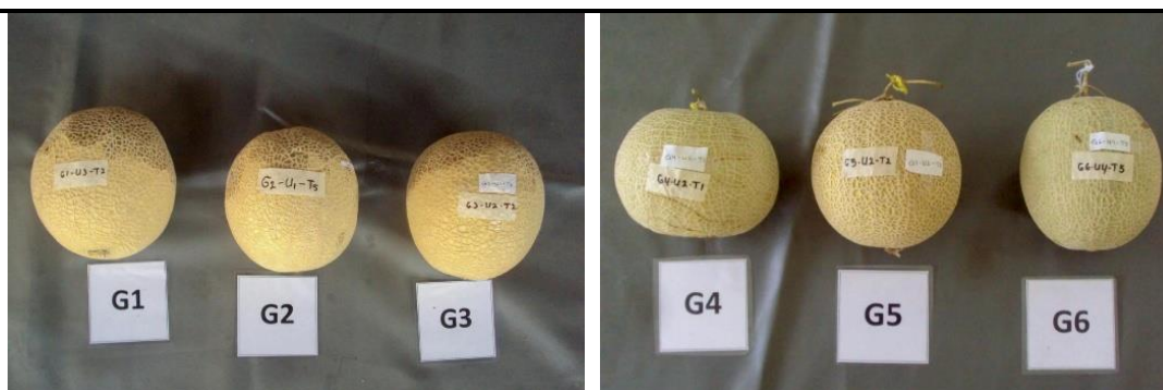
Gambar 5. Daya simpan buah

Dari aspek ekonomi, karakter kadar brix, ketebalan net, warna daging buah, ukuran buah, dan daya simpan memiliki korelasi langsung dengan harga jual melon di pasar. Melon dengan kadar brix tinggi dan net tebal rapat biasanya memiliki daya tarik visual yang lebih baik, memungkinkan penempatan sebagai segmen premium. Galur 5 memiliki nilai ekonomi tinggi karena menggabungkan kadar brix maksimal, net sangat tebal dan rapat serta daya simpan buah yang lebih lama, sehingga mengurangi tingkat kerusakan akibat distribusi. Galur 6 juga relevan bagi pasar premium dengan warna daging jingga kemerahannya yang membedakan dari galur lainnya.