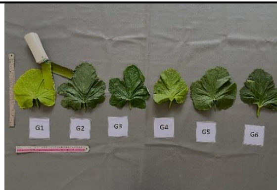
Gambar 1. Karakter daun

Pengamatan terhadap organ daun menunjukkan variasi morfologi yang spesifik antar galur pada parameter bentuk, warna, lekukan tepi daun serta perkembangan lobus. Berdasarkan panduan deskriptor IPGRI (2003), galur 1, galur 4, dan galur 5 memiliki bentuk daun utuh ( entire ), sementara variasi lain ditemukan pada galur 2 dan galur 3 ( pentalobate ) serta galur 6 ( trilobate ). Karakteristik tersebut dipertegas oleh kedalaman lekukan tepi daun, dimana galur 2 menunjukkan lekukan dalam ( deep ), berbeda dengan galur 1 dan galur 4 yang memiliki lekukan dangkal ( shallow ).