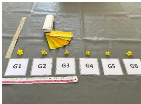
Gambar 2. Karakter bunga