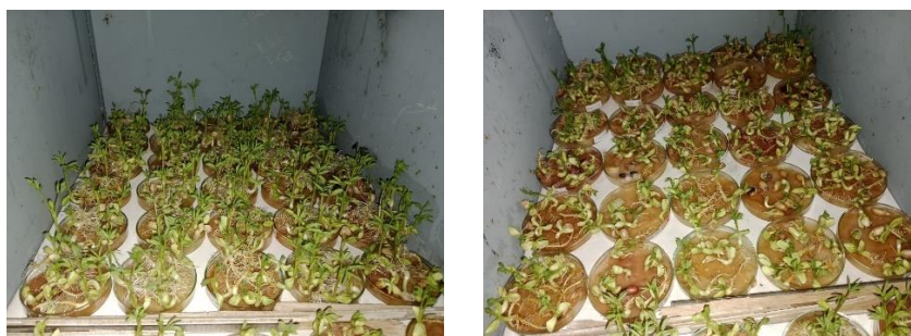
Gambar 2. Perbandingan perkecambahan tanaman kacang tanah dalam kondisi normal dan kondisi diberi perlakuan konsentrasi NaCl 45mM. Kiri (kontrol) dan kanan (perlakuan konsentrasi NaCl 45mM).

Data pada gambar menunjukkan bahwa genotipe G19-UI (47,38%), Bison (46,14%), Pelanduk (47,25%), G200-I (47,06%), dan G300-II (44,06%) mengalami penekanan akar paling besar. Nilai penekanan yang tinggi menandakan bahwa akar genotipe tersebut sangat terhambat dalam memanjangkan jaringan radikula ketika berada dalam kondisi salin. Sebaliknya, genotipe Panther (27,83%) dan Hypoma-I (23,04%) menunjukkan tingkat penekanan akar paling rendah dibandingkan genotipe lain. Rendahnya persentase penekanan ini mengindikasikan bahwa kedua genotipe tersebut memiliki toleransi lebih baik pada fase kecambah. Kemampuan mempertahankan panjang akar pada kondisi salinitas erat kaitannya dengan homeostasis ionik, terutama kemampuan menjaga rasio \text{K}^+/\text{Na}^+ tetap tinggi pada jaringan akar (Ginting et al. , 2021). Genotipe toleran juga diketahui memiliki kemampuan menghasilkan osmolit seperti prolin dan gula larut yang membantu menjaga turgor dan stabilitas sel meskipun lingkungan sekitar memiliki tekanan osmotik tinggi. Pada Tabel 1. juga menunjukkan bahwa genotipe Panther dan Hypoma-I termasuk kategori toleran pada panjang akar kecambah. Secara praktis, genotipe toleran seperti Hypoma-I dan Pelanduk berpotensi dimanfaatkan sebagai tetua dalam program pemuliaan kacang tanah toleran salinitas, sementara genotipe peka seperti G19-UI, Bison, Lokal Lombok, dan G200-I dapat dijadikan pembanding sensitif pada penelitian lanjutan mengenai mekanisme toleransi salinitas.