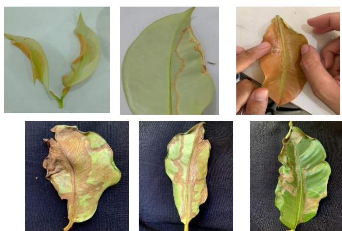
Gambar 3. Gejala Serangan Pada Daun

Pada tanaman manggis yang daunnya telah terkorok, gejala serangan awal pengorok daun pada saat dilakukan pengamatan dapat dilihat pada pucuk atau daun manggis yang masih muda. Gejala khas yang terlihat akibat serangan larva pengorok daun adalah adanya korokan di sepanjang daun yang berwarna keperakan atau garis putih yang berkelok-kelok dan garis berwarna kecokelatan. Saat menyerang daun tersebut larva membuat lorong di dalam jaringan daun. Larva hama ini menyerang dengan cara memakan bagian mesofil daun yang terlindungi oleh lapisan epidermis daun (Sari, et al. , 2016).