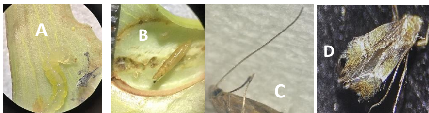
Gambar 1. A. Larva Pengorok Daun; B. Pupa; C. Kepala dan Antena; D. Imago Utuh

Didapatkan spesies serangga family Gracillariidae genus Phyllocnistis yang merupakan salah satu jenis hama pengorok daun. Menurut the Global Biodiversity Information Facility .