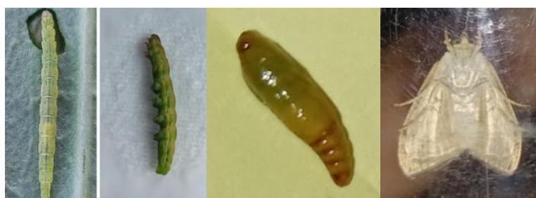
Gambar 2. Hasil Rearing (larva-pupa-imago)