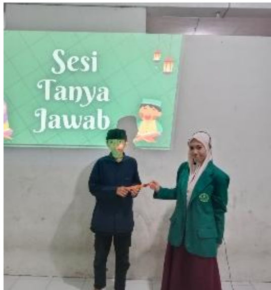
Gambar 4. Pemberian Apresiasi kepada Santri setelah Sesi Tanya Jawab.

Dengan demikian, tujuan kegiatan dalam meningkatkan pengetahuan santri mengenai ibadah puasa dapat dikatakan telah tercapai.