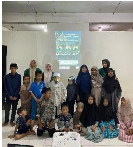
Gambar 5. Dokumentasi Foto Bersama Anak-Anak TPQ ITTAQU.

Pada tahap akhir kegiatan, dilakukan sesi dokumentasi foto bersama antara tim mahasiswa Universitas Sunan Giri Surabaya (UNSURI) dengan para santri yang telah mengikuti kegiatan edukasi Ramadan. Setelah mengajarkan seseorang tentang puasa, hal itu tidak hanya mengajarkan mereka untuk lebih sabar dan tidak mudah marah, tetapi juga menanamkan rasa empati dalam diri mereka (Dzakirah et al. , 2025).