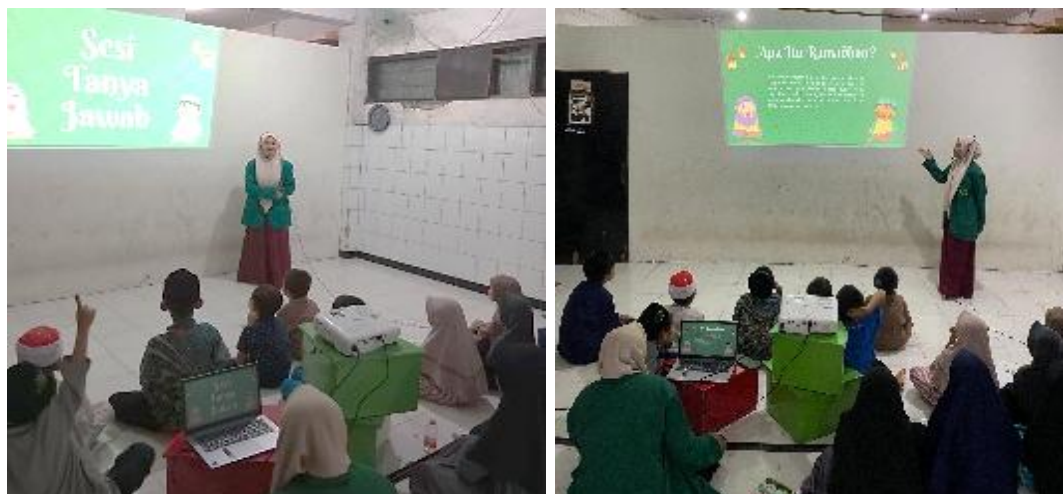
Gambar 2. Penyampaian Materi Edukasi Ramadan tentang “Apa Itu Ramadan?” kepada Santri oleh Tim Mahasiswa.

memberikan pemahaman dasar mengenai Ramadan kepada santri mulai tercapai dengan baik.