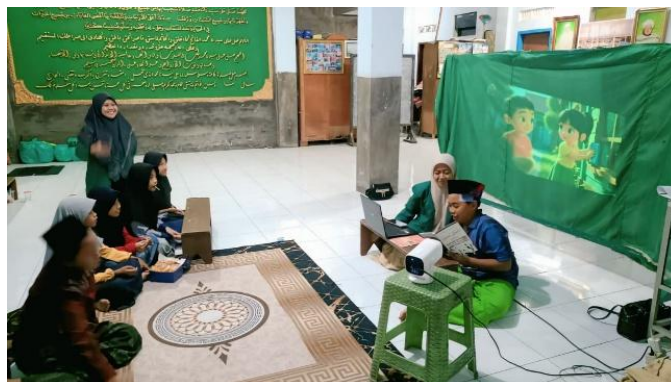
Gambar 4. Tahap Refleksi: Peserta Diminta Membaca Kitab Akhlaqul Banin .

Selama penyampaian materi, peserta terlihat memperhatikan penjelasan dengan baik dan sesekali terlibat dalam sesi tanya jawab. Kegiatan ini menunjukkan bahwa penyampaian materi secara langsung dan komunikatif membantu anak-anak lebih mudah memahami nilai-nilai akhlak yang diajarkan (Akbar & Azani, 2024).