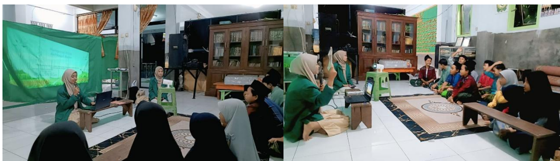
Gambar 3. Tahap Penyampaian Materi Tentang Akhlak dan Pengenalan Kitab Akhlaqul Banin kepada Anak.

Kegiatan ini menggambarkan proses penyampaian izin peminjaman tempat kepada pemilik pondok yang akan digunakan sebagai lokasi pelaksanaan kegiatan pendampingan pembelajaran kitab Akhlaqul Banin . Pada tahap ini, pelaksana kegiatan menyampaikan maksud dan tujuan kegiatan serta meminta persetujuan agar kegiatan dapat dilaksanakan dengan tertib dan lancar. Proses komunikasi dilakukan secara langsung dengan menjelaskan rencana kegiatan, waktu pelaksanaan, serta bentuk pembelajaran yang akan diberikan kepada anak-anak sekolah dasar (Supriono et al. , 2025). Kegiatan ini menunjukkan pentingnya koordinasi dan komunikasi dengan pihak setempat sebelum melaksanakan kegiatan pengabdian masyarakat. Dengan demikian, penyampaian izin kepada pemilik pondok menjadi langkah awal yang penting untuk memastikan kegiatan dapat terlaksana dengan baik dan mendapat dukungan dari lingkungan sekitar.