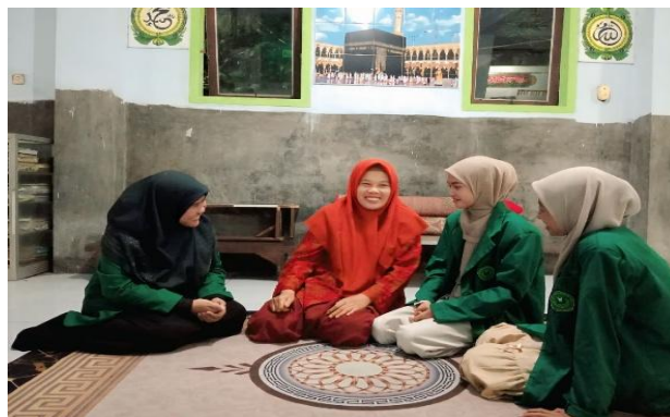
Gambar 2. Tahap Penyampaian Izin Peminjaman Tempat kepada Pemilik Pondok.

Terdapat beberapa tantangan dalam proses pembelajaran seperti perbedaan tingkat pemahaman peserta karena ada anak yang cepat memahami materi, sementara yang lain masih memerlukan penjelasan berulang. Selain itu, kegiatan yang dilaksanakan pada malam hari setelah salat tarawih membuat sebagian peserta mulai lelah sehingga pendamping perlu menggunakan cara penyampaian yang lebih menarik. Kondisi ini sejalan dengan temuan Ulum et al. (2025), bahwa perbedaan kemampuan peserta dan keterbatasan waktu dapat memengaruhi efektivitas pembelajaran.