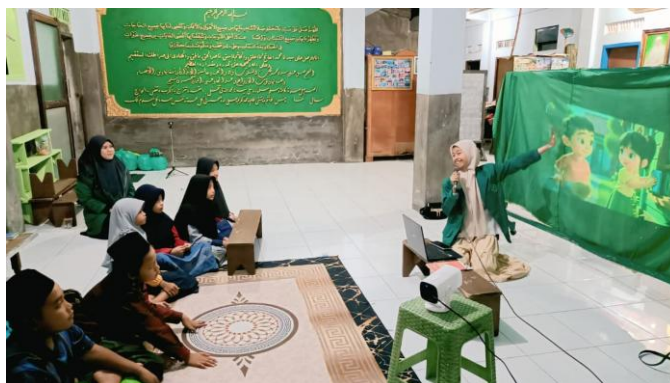
Gambar 5. Tahap Menonton Bersama (Nobar) Video Edukatif Islami.

Kegiatan ini menggambarkan tahap refleksi dalam kegiatan pendampingan pembelajaran kitab Akhlaqul Banin , ketika salah satu peserta maju ke depan untuk membaca isi kitab di hadapan teman-temannya. Pendamping memberikan kesempatan kepada peserta untuk mempraktikkan materi yang telah dipelajari sekaligus memperbaiki bacaan jika masih terdapat kesalahan. Kegiatan ini membantu peserta lebih memahami isi kitab serta meningkatkan keberanian dan kepercayaan diri dalam membaca dan menyampaikan materi. Hal ini sejalan dengan pendapat Sari dan Fikriyah (2022), bahwa praktik langsung dalam pembelajaran dapat meningkatkan pemahaman dan keterlibatan peserta.