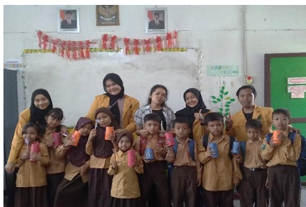
Gambar 5. Sesi Foto Bersama.

Selain itu, pengelolaan keuangan siswa/siswi SD Negeri 021 Samarinda Ulu juga mengalami peningkatan. siswa yang sebelumnya tidak terbiasa untuk menyisihkan uang saku untuk menabung kini mulai menyisihkan uang dan membeli makanan sesuai kebutuhan bukan keinginan. Hal tersebut menunjukkan bahwa melalui pengabdian masyarakat terkait program penyuluhan tentang literasi keuangan dan pentingnya menabung berhasil dilaksanakan. Adanya program pelatihan dan penyuluhan literasi keuangan dapat menumbuhkan kesadaran dan kemampuan dasar dalam mengelola uang secara bijak sejak dini serta meningkatkan pengetahuan dan pemahaman siswa dalam bidang literasi keuangan dasar (Lestari et al., 2025).