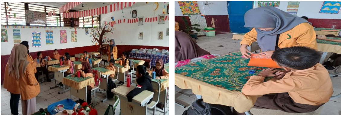
Gambar 3. Praktik Pembuatan Tabungan.

Setelah kegiatan penyampaian materi, pada pertemuan kedua terdapat praktik untuk menabung. Pada kegiatan ini peserta penyuluhan diajak untuk membuat tabungan dari barang-barang bekas seperti botol bekas air mineral 500 ml, kardus, kertas kado, lem tembak, kertas buffalo dan stiker sebagai penghias. Kemudian, para siswa mempraktikkan secara langsung pembuatan tabungan yang telah dicontohkan. Pelaksanaan dengan praktik langsung dapat memberikan pengalaman langsung kepada peserta kegiatan (Ghufron & Saraka, 2021). Selain itu, dengan adanya praktik dalam pembelajaran akan memperdalam keterampilan yang diajarkan (Lukman, 2021).