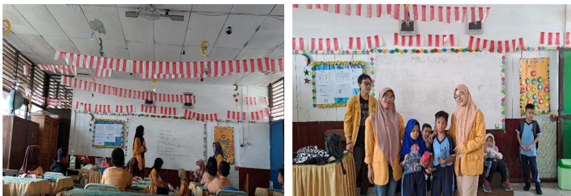
Gambar 4. Evaluasi Dari Pengajaran dan Praktik.

Hasil dari pelaksanaan program penyuluhan tentang literasi keuangan dan pentingnya menabung bagi peserta didik di SD Negeri 021 Samarinda Ulu menunjukkan bahwa penyuluhan dan pelatihan ini memberikan hasil yang positif yang berdampak pada pengetahuan dan pengelolaan keuangan siswa/i di SD Negeri 021 Samarinda Ulu. Hal tersebut dibuktikan melalui pengetahuan mengenai literasi keuangan dan pentingnya menabung pada siswa/siswi SD Negeri 021 Samarinda Ulu mengalami peningkatan. Dewi et al., (2026) menyatakan bahwa program penyuluhan mengenai literasi keuangan atau menabung yang disusun secara sistematis dan dikombinasikan dengan praktik langsung dapat memberikan dampak positif yang signifikan pada pemahaman, keterampilan, dan perilaku keuangan siswa. Peserta kegiatan terlihat sangat antusias dalam melaksanakan kegiatan yang dapat dilihat dari keaktifan mereka dalam mengikuti kegiatan penyuluhan.