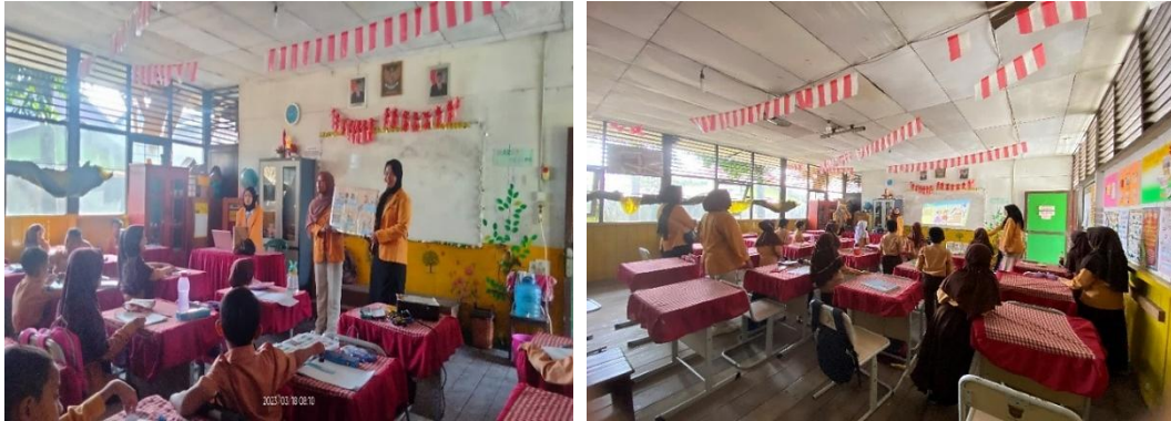
Gambar 2. Penyampaian Materi Penyuluhan Literasi Keuangan dan Pentingnya Menabung.

dan kebutuhan (Sulistiyowati et al., 2022). Materi yang disampaikan untuk anak usia sekolah dasar disesuaikan dengan materi literasi untuk anak usia sekolah.