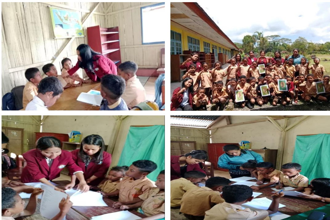
Gambar 2. Serba Serbi Kegiatan Pengabdian Masyarakat di SDI Wogo.

Kegiatan pengabdian ini telah dilaksanakan di SDI Wogo dengan membuahkan hasil buku cerita rakyat, yaitu: (1) Watu Kaba , (2) Air panas Deratei , (3) Riku dan Rede , (4) Ebu Gogo , (5) Tepa Lelu , (6) Bue Dheke , (7) Watu mengeo . Dari cerita rakyat yang telah dihasilkan diimplementasikan pada siswa kelas III SDI Wogo.