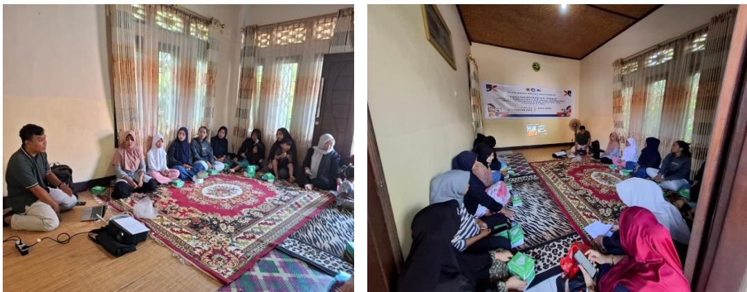
Gambar 2. Sosialisasi Materi Pengabdian dan Pengerjaan Soal Tes.

Kegiatan pengabdian masyarakat yang berjudul “Peningkatan Pengetahuan Terkait Kesehatan Reproduksi Remaja melalui Sosialisasi Berbasis Pendidikan Bahasa Indonesia di Kecamatan Gerung” telah dilaksanakan dengan baik dan sesuai dengan rencana. Peserta yang terlibat berjumlah sekitar 20-30 remaja dengan latar belakang pendidikan yang sangat beragam. Dalam kegiatan ini, berbagai metode disesuaikan dengan kebutuhan dan kondisi peserta, termasuk pemaparan materi melalui video edukasi, diskusi kelompok, sesi tanya jawab, dan pembelajaran berbasis aplikasi digital. Bahasa Indonesia dipilih sebagai bahasa utama dalam penyampaian materi agar peserta mudah memahami serta untuk membiasakan remaja menggunakan istilah-istilah kesehatan reproduksi dengan benar.