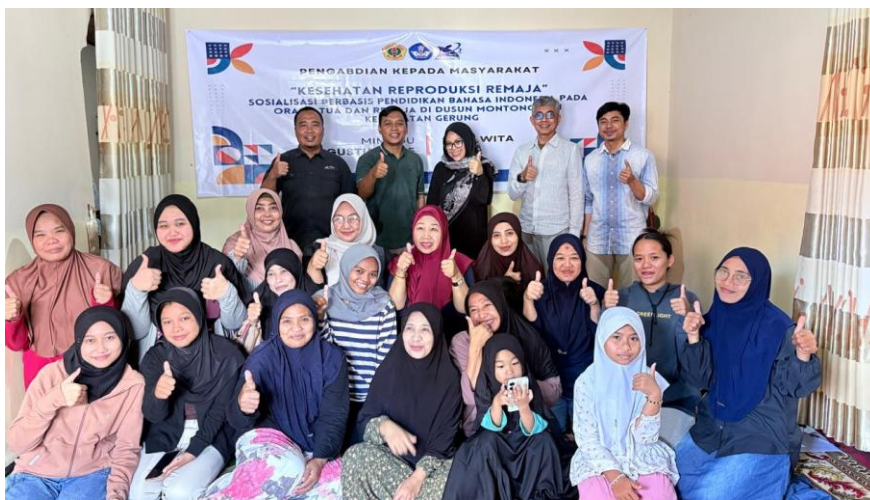
Gambar 3. Foto Bersama Tim Pengabdian dan Peserta.

Pemanfaatan teknologi digital juga menjadi salah satu kunci keberhasilan dalam memperluas jangkauan kegiatan ini. Platform seperti WhatsApp dan Instagram digunakan untuk mendukung keberlanjutan kegiatan. Peserta dapat mengakses kembali materi, berdiskusi lebih lanjut di luar pertemuan, dan berbagi informasi dengan teman-teman mereka. Mayer (2001) dalam Cognitive Theory of Multimedia Learning menjelaskan bahwa penyampaian informasi melalui kombinasi teks, gambar, dan suara dapat meningkatkan pemahaman, karena otak bekerja lebih optimal ketika menerima informasi dari berbagai jalur. Oleh karena itu, penggunaan media digital menjadi relevan untuk memfasilitasi kebutuhan belajar remaja masa kini yang sangat bergantung pada teknologi.