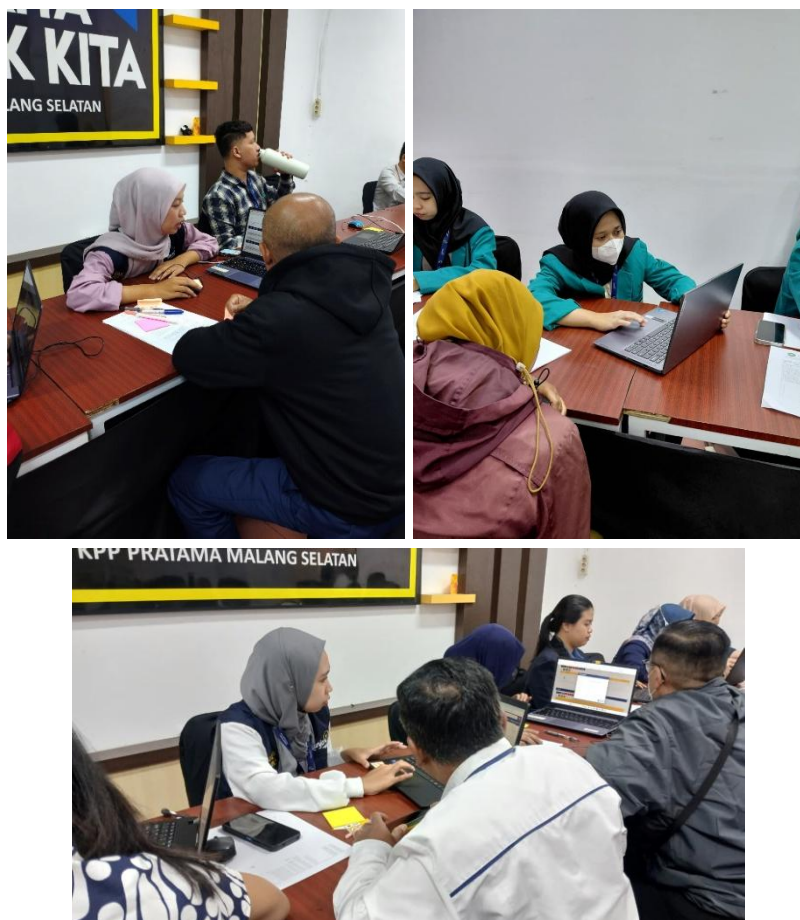
Gambar 1 Kegiatan One-On-One Assistance dalam Pelaporan e-SPT melalui Coretax.

Pendekatan one-on-one assistance yang diterapkan dalam kegiatan ini terbukti efektif dalam menyelesaikan kendala teknis WP secara individual. Sebelum dilakukan pendampingan, sebagian besar WP yang datang ke KPP belum mampu menyelesaikan proses pelaporan secara mandiri akibat kendala akses akun maupun ketidakpahaman terhadap prosedur sistem Coretax. Setelah mendapatkan asistensi langsung dari relawan pajak, mayoritas WP berhasil menyelesaikan pelaporan hingga memperoleh BPE. Capaian rasio kepatuhan sebesar 95,4% di KPP Pratama Malang Selatan didukung oleh kontribusi langsung relawan pajak yang berhasil mendampingi 23.597 WP dari total 44.105 SPT yang masuk, sehingga proporsi kontribusi relawan pajak terhadap total SPT yang dihimpun mencapai sekitar 53,5% (23.597 dari 44.105 SPT). Angka tersebut melampaui angka kepatuhan nasional tahun 2023 sebesar 86,97% (Direktorat Jenderal Pajak, 2023) dan melampaui capaian program serupa di KP2KP Bangil yang mendampingi 2.988 WP (Nandiroh et al., 2025) dan di KPP Pratama Mataram Timur yang mendampingi 2.075 WP dengan pendekatan yang sebanding (Handayani et al., 2025) menunjukkan efektivitas yang tinggi dalam konteks transisi sistem Coretax.