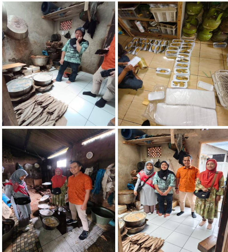
Gambar 1. Kondisi Usaha UMKM Ikan Pindang Rumahan Desa Kiangroke.

UMKM ikan pindang rumahan yang ada di desa ini sebagian besar mengambil bahan baku ikan mentah dari PD Juana Mandiri. Produksi ikan pindang setiap harinya sudah disesuaikan dengan permintaan tetap dari pelanggan dan tidak ada stok barang yang tersisa. Sebagian besar UMKM masih bergantung pada penjualan langsung ke pelanggan perorangan atau pasar tradisional di sekitar kabupaten Bandung seperti Pasar Soreang.