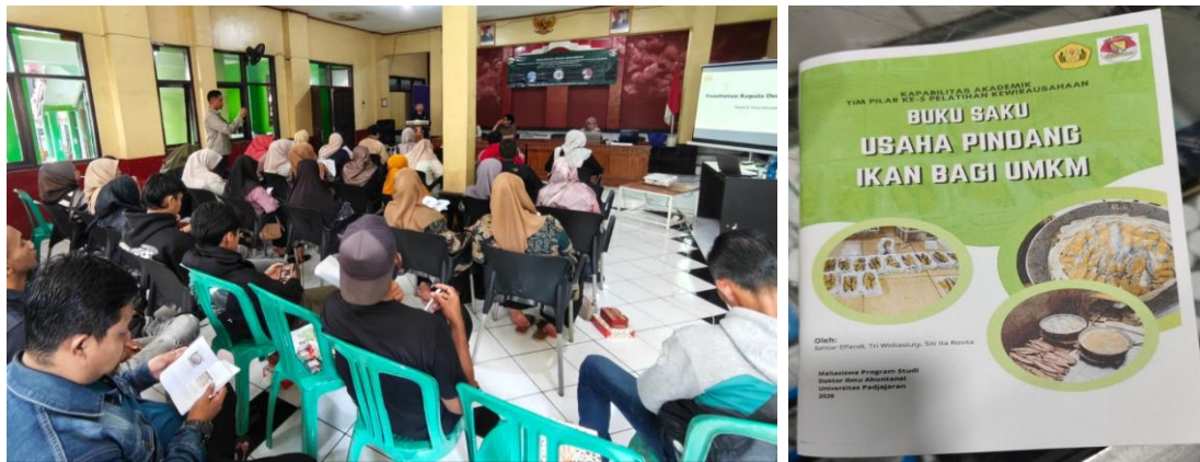
Gambar 3. Kiri: Sesi Pelatihan UMKM Ikan Pindang Desa Kiangroke; Kanan: Buku Saku Panduan Sederhana Usaha Ikan Pindang bagi UMKM.

materi yang diberikan adalah pengenalan bisnis ikan pindang, strategi pemasaran, manajemen operasional, proses produksi, dan konsep keberlanjutan usaha. Materi ini juga dirangkum dalam buku saku sebagai panduan praktis.