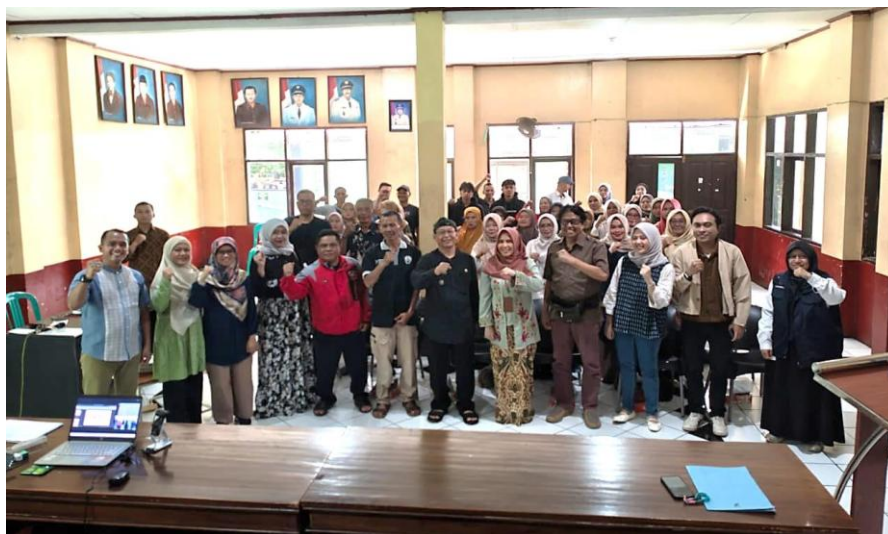
Gambar 3. Foto Bersama Dispakan Kabupaten Bandung, Penyuluh, Akademisi Unpad, Kepala Desa, dan Peserta Pelatihan.

Peserta pelatihan terlibat aktif dalam diskusi, praktik penggunaan aplikasi, serta interaksi selama pelatihan berlangsung. Peserta tidak hanya menerima materi, tetapi juga berbagi pengalaman dan permasalahan yang dihadapi dalam menjalankan usaha.