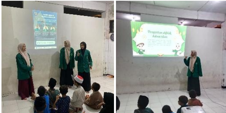
Gambar 2. Seminar Edukasi Puasa Ramadan dan Penyampaian Materi Akhlak dalam Islam.