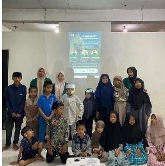
Gambar 4. Foto Bersama Peserta Program Edukasi Ramadan.

dan santri. Selain itu, kegiatan ini turut mendukung terciptanya suasana pembelajaran yang positif dan mendorong partisipasi aktif dalam kegiatan edukatif (Fekrat et al., 2024). Oleh karena itu, kegiatan pemberian hadiah sebagai bentuk apresiasi yang mampu meningkatkan motivasi dan partisipasi aktif santri dalam proses pembelajaran. Interaksi yang terjalin antara pemateri dan peserta menciptakan suasana belajar yang positif serta mempererat hubungan sosial. Dengan demikian, kegiatan ini tidak hanya memberikan penghargaan, tetapi juga berperan dalam mendukung efektivitas pembelajaran dan menumbuhkan semangat belajar santri secara berkelanjutan.