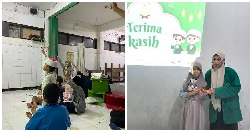
Gambar 3. Kegiatan Kuis Interaktif Ramadan dan Penyerahan Hadiah Kuis.

Pelaksanaan kegiatan kuis interaktif di TPQ Ittaqu Menanggal Surabaya yang berlangsung dalam suasana aktif dan penuh antusiasme dari para santri. Kegiatan ini dirancang untuk meningkatkan pemahaman sekaligus keterlibatan peserta dalam materi edukasi Ramadan melalui sesi tanya jawab dan interaksi langsung. Suasana yang terbuka dan komunikatif mendukung proses pembelajaran menjadi lebih efektif dan menyenangkan. Melalui kegiatan ini, santri tidak hanya memahami materi secara kognitif, tetapi juga terdorong untuk mengamalkan nilai-nilai akhlak Islami dalam kehidupan sehari-hari sebagai bentuk implementasi dari ajaran yang telah dipelajari. Kegiatan ini mampu menciptakan suasana pembelajaran yang aktif, komunikatif, dan menyenangkan, sehingga meningkatkan pemahaman serta keterlibatan santri dalam materi edukasi Ramadan. Melalui interaksi langsung, kegiatan ini tidak hanya memperkuat aspek kognitif, tetapi juga mendorong pengamalan nilai-nilai akhlak Islami dalam kehidupan sehari-hari, sehingga berkontribusi dalam pembentukan karakter santri secara optimal.