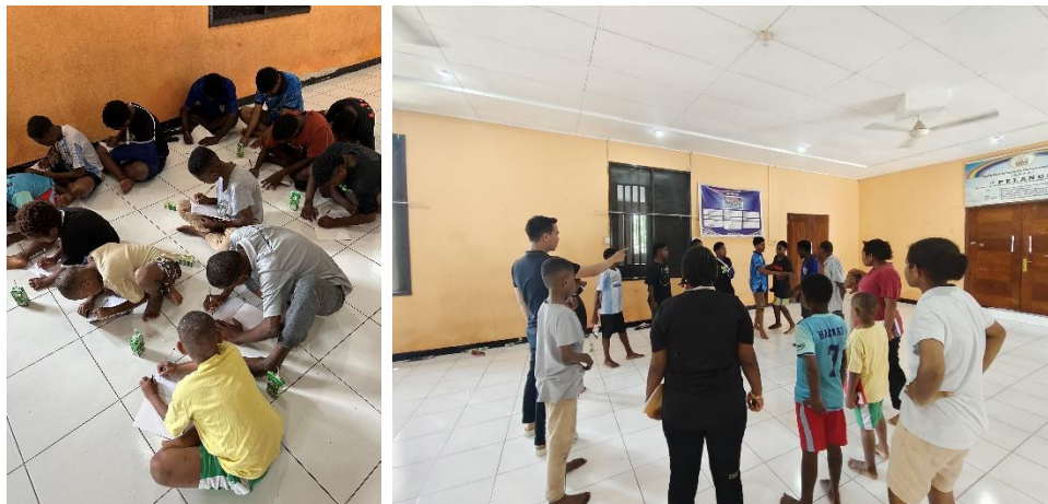
Gambar 3. Kegiatan Edukatif dan Bermain.

Tujuan ketiga, yaitu menghasilkan model pembinaan berkelanjutan, terealisasi melalui pengembangan modul aplikatif yang dapat digunakan secara mandiri oleh pengasuh. Keberlanjutan merupakan aspek krusial dalam pendidikan karakter karena perubahan perilaku memerlukan proses yang konsisten dan berulang. Dengan tersedianya modul, kegiatan tidak berhenti pada satu intervensi jangka pendek, melainkan memiliki potensi untuk diintegrasikan sebagai program rutin pembinaan karakter di panti asuhan. Hal ini menjadi pembeda penting dibandingkan program pengabdian yang bersifat episodik tanpa tindak lanjut sistematis.