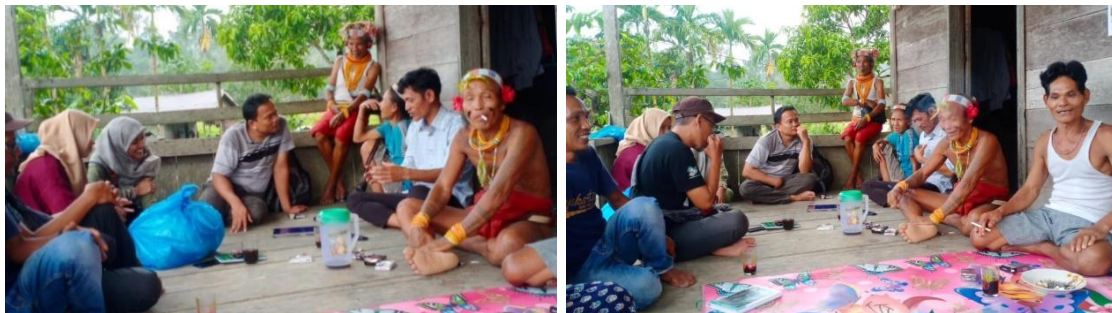
Gambar 2. Sikerei Pedalaman yang Dipercaya bisa Menyembuhkan Penyakit.

Dengan begitu, hubungan DKV dan semiotika pada Sikerei Mentawai bukan hanya soal estetika visual, tetapi lebih dalam bagaimana tanda budaya dijaga, diterjemahkan, dan dikomunikasikan kembali kepada audiens modern. Hasilnya, nilai kearifan lokal tetap lestari sekaligus mendapat ruang apresiasi baru dalam konteks global.