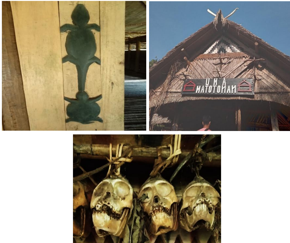
Gambar 3. Kiri Atas: Ukiran Biawak ( Batek ) dan Kura-Kura ( Toulu ) yang Diukir di Rumah Uma ; Kanan Atas: Rumah Uma Matotonan yang Dipertuahkan Masyarakat Matotonan; Bawah: Hasil Buruan Kera yang Dipajang di Sekitar Rumah Warga.

Lebih tepatnya gambar tersebut dalam ukiran kayu di dinding Uma sebagai hiasan dinding agar terlihat estetik dan memiliki arti sesuai kepercayaan masyarakat sekitar (Wawancara dengan Arif selaku masyarakat Matotonan pada 2025). Oleh karena itu dengan adanya ukiran gambar hewan yang dipajang di samping dan di atas rumah Uma tersebut menandakan kehidupan masyarakat menyatu dengan alam. Beberapa hewan yang dipajang memiliki arti dalam kehidupan masyarakat Matotonan.