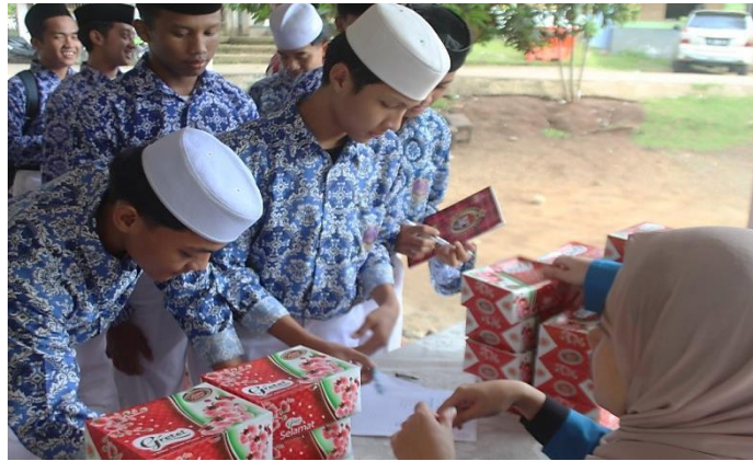
Gambar 2. Registrasi Peserta PKM.

Menindaklanjuti hasil analisis kebutuhan dan permasalahan yang ditemukan, tahapan sosialisasi dilaksanakan sebagai upaya awal untuk membangun kesadaran dan pemahaman peserta mengenai pemanfaatan media sosial secara positif dalam pembelajaran menulis dalam bahasa Inggris. Sosialisasi difokuskan pada perubahan paradigma peserta dari sekadar pengguna media sosial menjadi pembelajar aktif yang mampu memanfaatkan platform digital sebagai sarana pengembangan kompetensi bahasa.