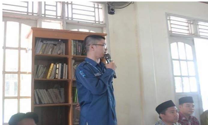
Gambar 3. Pemaparan Materi oleh Narasumber.

Peserta dilibatkan dalam berbagai aktivitas menulis berbasis media sosial, seperti penulisan caption edukatif, refleksi singkat, dan komentar konstruktif dalam bahasa Inggris. Aktivitas ini dirancang untuk membiasakan peserta menulis secara rutin dan mengekspresikan ide dalam konteks komunikasi digital yang nyata. Pendekatan ini sejalan dengan pandangan bahwa pembelajaran menulis akan lebih efektif apabila dilakukan melalui praktik langsung dalam lingkungan autentik (Saragih et al., 2023).