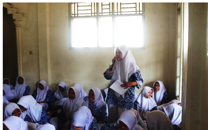
Gambar 4. Interaksi Peserta terhadap Pemaparan Materi.

Selama pelaksanaan kegiatan, tim pengabdian memberikan pendampingan dan umpan balik terhadap hasil tulisan peserta. Umpan balik difokuskan pada aspek kebahasaan, pengembangan ide, serta kesesuaian konteks tulisan dengan tujuan komunikasi. Proses ini bertujuan untuk membantu peserta memperbaiki kualitas tulisan secara bertahap dan meningkatkan kesadaran mereka terhadap penggunaan bahasa Inggris yang lebih tepat di media sosial. Pelaksanaan program juga menekankan pentingnya etika berbahasa dan literasi digital. Peserta diajak untuk memahami bahwa media sosial tidak hanya menuntut kemampuan teknis, tetapi juga tanggung jawab dalam memproduksi konten tertulis. Integrasi media sosial dalam pembelajaran bahasa harus disertai dengan penguatan sikap positif dan etis dalam berkomunikasi di ruang digital (Fitriani et al., 2020; Manik, 2024; Romadhonah et al., 2025).