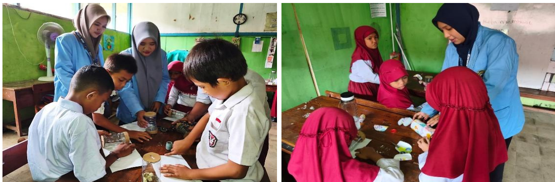
Gambar 3. Praktik Pembuatan dan Penghiasan Celengan.

Selanjutnya, tim mahasiswa PPL melaksanakan praktik pembuatan dan penghiasan celengan dari botol bekas bersama siswa. Setiap siswa memperoleh botol bekas beserta alat dan bahan pendukung untuk membuat serta menghias celengan sesuai kreativitas masing-masing sebagaimana tampak pada gambar berikut.