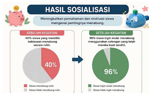
Gambar 4. Hasil Peningkatan Pemahaman Siswa Sebelum-Sesudah Kegiatan.

Kegiatan sosialisasi ini berhasil meningkatkan pemahaman dan motivasi siswa mengenai pentingnya menabung. Berdasarkan hasil observasi dan angket, seluruh siswa telah memahami pengertian dasar tentang menabung. Sebelum kegiatan dilaksanakan, hanya sekitar 40% siswa yang memiliki kebiasaan menabung secara rutin. Setelah mengikuti kegiatan, sekitar 96% siswa menyatakan keinginan untuk mulai menabung menggunakan celengan yang telah mereka buat sendiri. Di samping itu, indikator lainnya dapat dilihat dari keaktifan siswa mengikuti penyampaian materi, sesi tanya jawab, hingga praktik pembuatan celengan di mana sebagian besar siswa mampu menyelesaikan pembuatan celengan secara mandiri dengan hasil yang kreatif sebagaimana tampak pada gambar berikut.