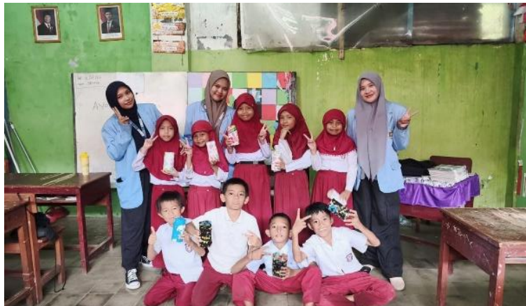
Gambar 5. Sesi Foto Bersama Siswa.

Setelah seluruh rangkaian kegiatan sosialisasi selesai dilaksanakan, tim pelaksana menutup kegiatan pengabdian. Pada tahap penutupan, tim pelaksana menyampaikan apresiasi dan ucapan terima kasih kepada seluruh siswa atas antusiasme serta partisipasi aktif mereka selama mengikuti kegiatan sosialisasi dan praktik pembuatan celengan. Sebagai bagian dari rangkaian penutupan kegiatan, tim pelaksana mengadakan sesi dokumentasi dan foto bersama dengan siswa kelas IV SD Islam Paropo.