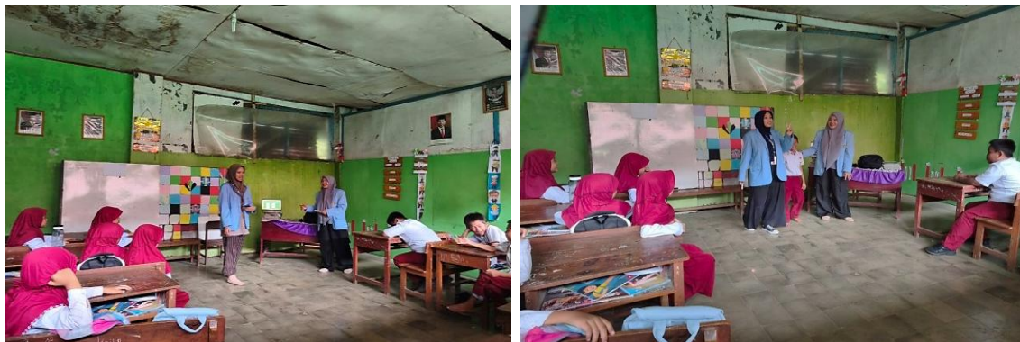
Gambar 2. Kiri: Penyampaian Materi oleh Tim PkM; Kanan: Sesi Tanya Jawab.

Setelah sesi pembukaan, pemateri menyampaikan informasi tentang pentingnya menabung sejak dini dengan cara yang menarik dan mudah dipahami oleh siswa. Materi yang disampaikan meliputi pengertian menabung, manfaat menabung, pentingnya hidup hemat, dan cara mudah mengelola uang saku. Para siswa memperhatikan penjelasan dengan serius dan antusias, sehingga kegiatan berjalan dengan baik. Untuk memastikan proses penyampaian materi berjalan dengan efektif, seluruh tim mahasiswa PPL secara aktif menjaga kelas tetap teratur dan tenang. Proses penyampaian materi dapat dilihat pada Gambar 2.