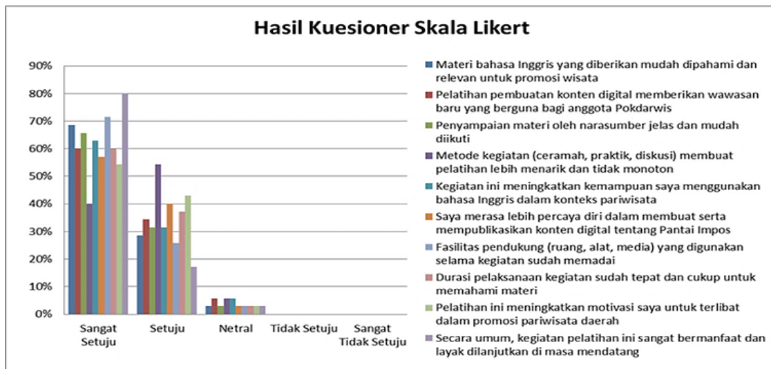
Gambar 3. Hasil Kuesioner Skala Likert.

menyatakan Netral (2,9%–5,7%), sementara kategori Tidak Setuju dan Sangat Tidak Setuju tidak muncul sama sekali. Indikator mengenai relevansi dan kejelasan materi mencatat nilai Sangat Setuju di kisaran 60%–70%, menunjukkan bahwa pelatihan berhasil menjawab kebutuhan peserta.