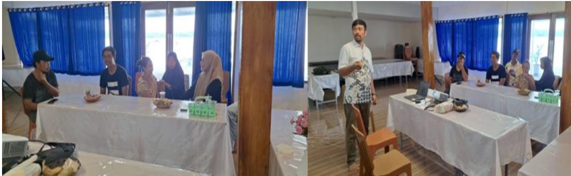
Gambar 2. Pelatihan Penggunaan Media Sosial dan Pembuatan Konten Digital.

Selanjutnya adalah pelatihan penggunaan media sosial untuk branding destinasi. Peserta diperkenalkan pada fitur-fitur utama platform seperti Instagram, Facebook, dan TikTok, termasuk cara menggunakan hashtag, memilih waktu unggah yang efektif, membuat deskripsi singkat yang menarik, serta memahami cara kerja algoritma sederhana. Pemateri juga menampilkan contoh caption promosi yang baik dan membandingkannya dengan unggahan yang kurang optimal, sehingga peserta dapat melihat perbedaan secara langsung.