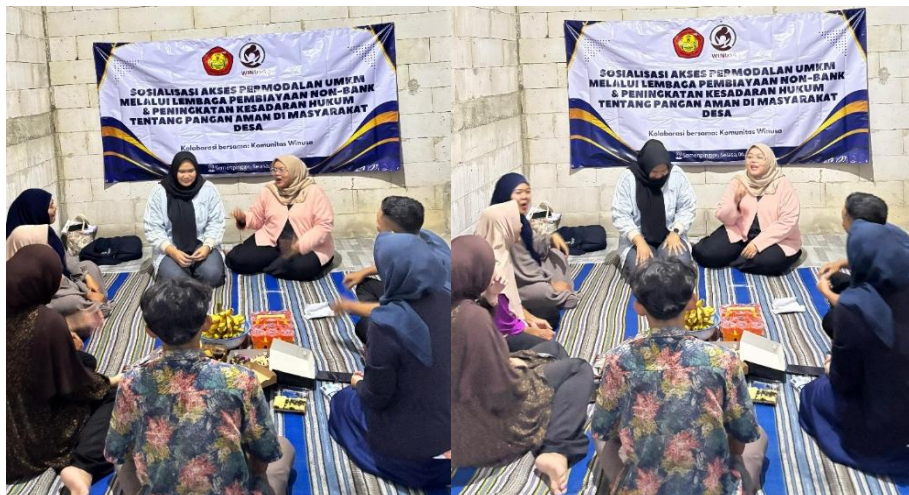
Gambar 2. Pemaparan Materi oleh Narasumber dan Sesi Tanya Jawab.

PT Permodalan Nasional Madani (PNM) mengawasi proyek-proyek pembangunan terpadu untuk sejumlah organisasi pembiayaan nonbank, termasuk ULaMM dan Mekaar. Inisiatif-inisiatif ini menawarkan bantuan manajemen, pelatihan bisnis, dan pendampingan bagi usaha mikro dan kecil, di samping bantuan pembiayaan. Dengan menggunakan strategi ini, organisasi pembiayaan nonbank berkontribusi pada semangat kewirausahaan dan kemampuan manajemen perusahaan masyarakat, di samping menyediakan modal kerja.