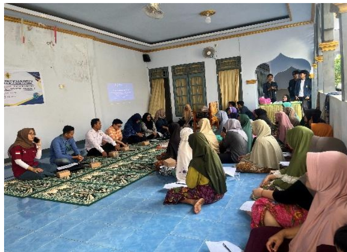
Gambar 2. Penyampaian Materi oleh Tim Pengabdian.

Tahap pertama pada pelaksanaan pelatihan, peserta menerima materi teoritis untuk memperkuat pemahaman peserta mengenai literasi keuangan dan pembukuan sederhana. Antusiasme peserta tampak tinggi, yang tercermin dari keaktifan dalam diskusi serta kemampuan dalam mengidentifikasi permasalahan keuangan usaha yang dihadapi. Sebelum pelatihan, sebagian besar peserta belum memiliki sistem pencatatan keuangan yang terstruktur dan masih mengandalkan pencatatan sederhana atau ingatan. Kondisi ini sejalan dengan temuan bahwa rendahnya literasi keuangan masih menjadi hambatan utama bagi UMKM dalam pengelolaan usaha (Samsul et al., 2023).