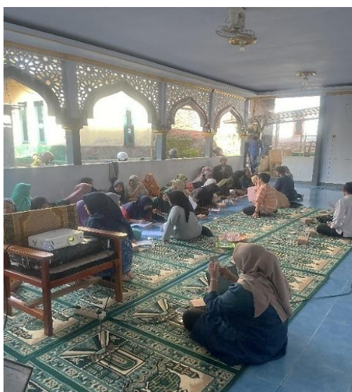
Gambar 4. Pendampingan Penggunaan Aplikasi Pembukuan Digital oleh Tim Pengabdian.

Penggunaan aplikasi pembukuan digital dalam kegiatan ini memberikan pengalaman baru bagi peserta dalam mengelola keuangan usaha secara lebih modern. Digitalisasi memungkinkan pencatatan yang lebih efisien, penyimpanan data yang lebih aman, serta kemudahan dalam mengakses informasi keuangan secara real-time. Hal ini sejalan dengan kajian yang menyatakan bahwa literasi keuangan digital dapat meningkatkan efisiensi, akses pembiayaan, serta daya saing UMKM di era digital (Fitriani et al., 2024). Selain itu, integrasi literasi keuangan dan literasi digital juga terbukti mampu meningkatkan performa usaha, termasuk peningkatan penjualan dan pengambilan keputusan yang lebih baik (Yulian & Mudiharso, 2026); (Demetrius, 2025).