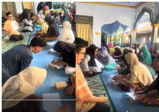
Gambar 3. Kegiatan Simulasi Pencatatan Keuangan.

Selain itu, digitalisasi pembukuan terbukti memberikan kemudahan dalam pencatatan, meningkatkan efisiensi, serta mengurangi kesalahan pencatatan manual. Penelitian lain juga menunjukkan bahwa penerapan pembukuan digital mampu meningkatkan kualitas laporan keuangan dan transparansi usaha (Dewi et al., 2026).