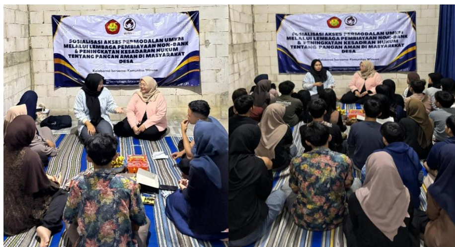
Gambar 2. Pemuda Pemudi Sedang Mendengarkan Pemaparan Materi.

Secara hukum, keadaan ini menunjukkan bahwa masyarakat belum sepenuhnya memahami dan menerapkan persyaratan “Undang-Undang Nomor 8 Tahun 1999 tentang Perlindungan Konsumen. Perundang-undangan ini menjamin keselamatan dan keamanan konsumen serta secara tegas memberikan hak kepada konsumen untuk mendapatkan informasi yang akurat, transparan, dan benar tentang kondisi produk yang mereka gunakan. Selain itu, dalam Undang-Undang Nomor 18 Tahun 2012 tentang Pangan juga ditegaskan bahwa setiap pangan yang beredar harus memenuhi standar keamanan, mutu, dan kelayakan konsumsi.” Namun, keterbatasan pemahaman masyarakat terhadap regulasi tersebut menyebabkan hak-hak konsumen belum dimanfaatkan secara optimal.