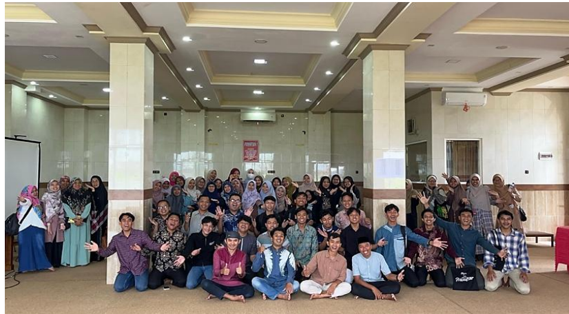
Gambar 5. Komunitas Guru Anak Usia Dini dan Sekolah Dasar (Caberawit) Roudhotul Jannah, Malang.

Hasil refleksi menunjukkan bahwa keterlibatan dalam komunitas tidak hanya meningkatkan wawasan, tetapi juga membangun kepercayaan diri dan motivasi untuk mengimplementasikan perubahan dalam praktik pembelajaran. Hal ini sejalan dengan konsep communities of practice yang menekankan bahwa pembelajaran profesional terjadi melalui partisipasi dalam komunitas yang memiliki tujuan bersama (Wenger, 1998).