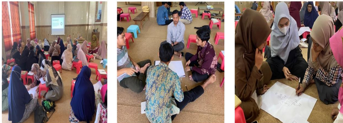
Gambar 3. Sesi Focus Group Discussion .

Tahap kedua adalah diskusi kelompok melalui FGD, di mana peserta berbagi pengalaman mengajar, mengidentifikasi tantangan yang dihadapi, serta mendiskusikan strategi pembelajaran yang lebih adaptif. Proses ini mendorong terjadinya pertukaran ide dan pembelajaran kolaboratif antar peserta.