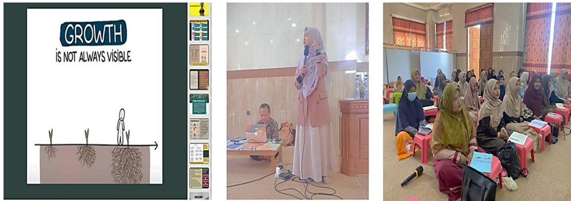
Gambar 2. Sesi Paparan Materi.

Tahap kedua adalah diskusi kelompok melalui FGD, di mana peserta berbagi pengalaman mengajar, mengidentifikasi tantangan yang dihadapi, serta mendiskusikan strategi pembelajaran yang lebih adaptif. Proses ini mendorong terjadinya pertukaran ide dan pembelajaran kolaboratif antar peserta.