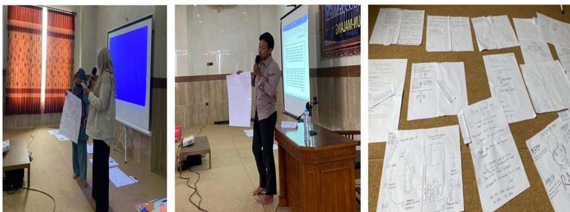
Gambar 4. Sesi Tanya Jawab dan Refleksi.

Tahap ketiga adalah sesi tanya jawab yang memberikan ruang bagi peserta untuk mengklarifikasi pemahaman dan memperdalam materi yang telah disampaikan. Tahap keempat adalah refleksi individu dan kelompok, di mana peserta merefleksikan praktik pembelajaran yang telah dilakukan serta merumuskan rencana perbaikan yang dapat diimplementasikan di kelas masing-masing.