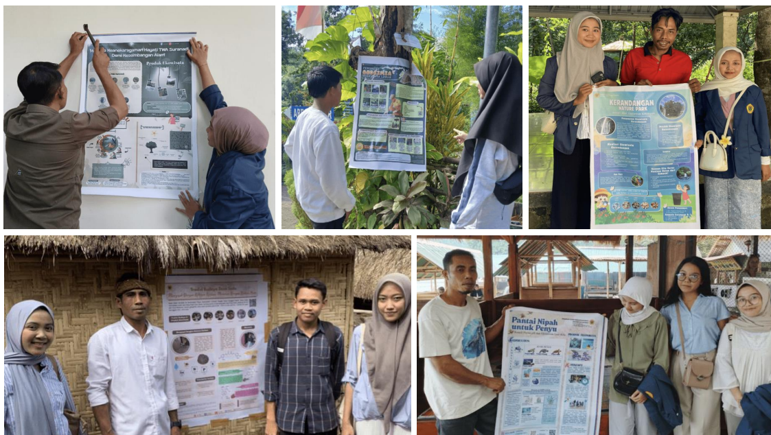
Gambar 3. Sosialisasi dan Diseminasi Poster Edu-ekowisata.

ekowisata di tempat strategi yang sering dilalui oleh wisatawan yang ditunjukkan pada Gambar 3.