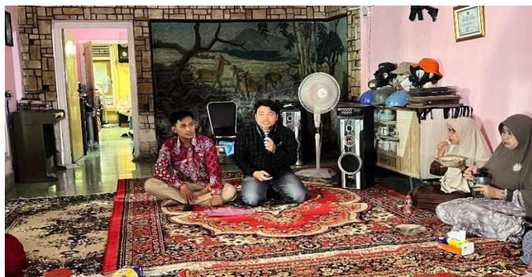
Gambar 1. Penyampaian Materi DAGUSIBU.

Materi berikutnya menjelaskan cara menggunakan obat secara benar, yang meliputi penjelasan dosis, frekuensi minum obat, waktu pemberian yang tepat, serta pentingnya kepatuhan minum obat ( drug adherence ), karena lansia rentan mengalami polifarmasi dan risiko salah minum obat. Selanjutnya, disampaikan cara menyimpan obat dengan benar, seperti memisahkan obat yang mirip, menyimpan obat rutin dalam kotak pil ( pill organizer ), serta melakukan pengecekan tanggal kedaluwarsa secara berkala. Materi terakhir membahas tata cara membuang obat kedaluwarsa agar tidak disalahgunakan atau membahayakan anggota keluarga lain, khususnya cucu atau anak kecil di rumah. Penyuluhan ini bertujuan untuk meningkatkan pengetahuan dan kemandirian lansia dalam mengelola obat sehari-hari dengan aman, sesuai dengan pedoman BPOM dan program Gema Cermat (BPOM RI, 2021).