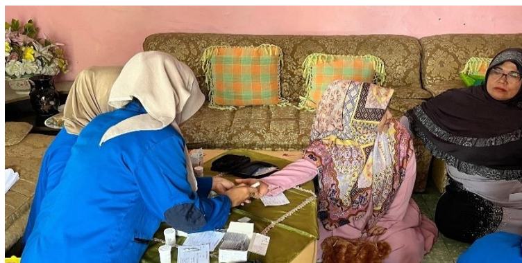
Gambar 2. Cek Kesehatan Gratis.

Kegiatan PKM ini fokus pada kelompok lansia sebagai peserta edukasi. Pemilihan sasaran lansia dilakukan karena kelompok usia ini merupakan pengguna obat terbesar dan paling rentan mengalami kesalahan penggunaan obat akibat kondisi kesehatan yang kompleks, polifarmasi, serta penurunan fungsi kognitif dan penglihatan. Penyampaian materi dilakukan dengan metode ceramah interaktif menggunakan slide berukuran besar, bahasa sederhana, dan ilustrasi visual agar mudah dipahami oleh lansia. Demonstrasi langsung dilakukan terkait cara membaca label obat, membedakan obat yang memiliki bentuk mirip, penggunaan kotak obat harian, dan praktik memilih tempat penyimpanan obat yang aman di rumah. Para lansia tampak antusias dan aktif berdiskusi, terutama mengenai cara minum obat penyakit kronis seperti hipertensi, diabetes, dan asam urat.