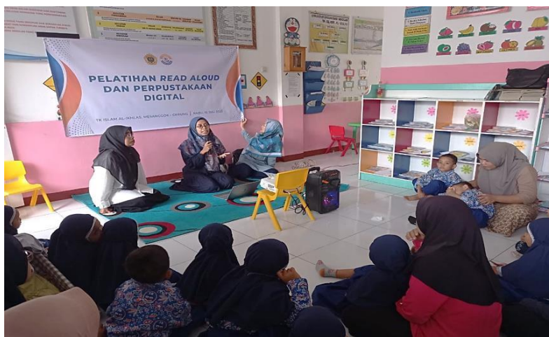
Gambar 3. Penjelasan Teknik Read Aloud .

Integrasi pelatihan read aloud dengan pemanfaatan perpustakaan digital memiliki potensi besar dalam mendukung Gerakan Literasi Nasional. Melalui read aloud , peserta didik dibekali keterampilan literasi awal, seperti kemampuan memahami kosakata, mengembangkan imajinasi, dan menumbuhkan rasa ingin tahu. Salsabela et al. (2024) menunjukkan bahwa penerapan metode read aloud terbukti meningkatkan kemampuan bahasa reseptif anak usia dini secara signifikan.