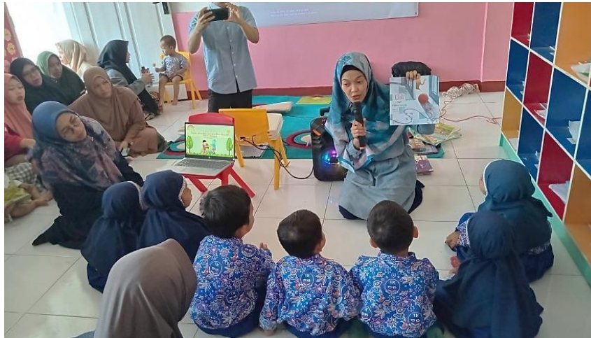
Gambar 4. Praktik Read Aloud .

dongeng pada siswa sekolah dasar, sekaligus menumbuhkan budaya membaca sejak dini. Dengan demikian, keberadaan perpustakaan digital melengkapi peran read aloud dengan menyediakan variasi bahan bacaan yang lebih kaya dan interaktif.