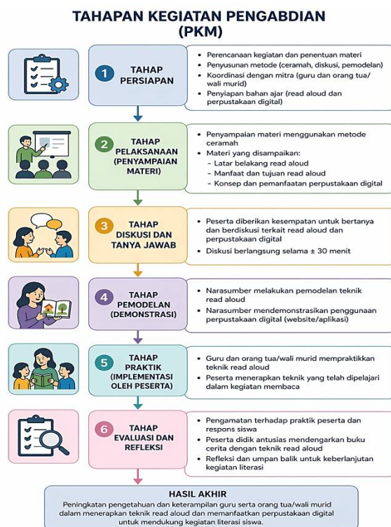
Gambar 2. Tahapan Kegiatan PKM di TK Al-Ikhlas Mesanggok Gerung.

pemodelan atau demonstrasi teknik read aloud serta penggunaan perpustakaan digital.